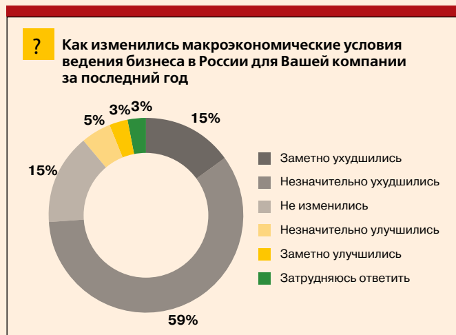
Диаграмма 1. Результаты опроса иностранных компаний об изменении условий ведения бизнеса в России в 2015 г.