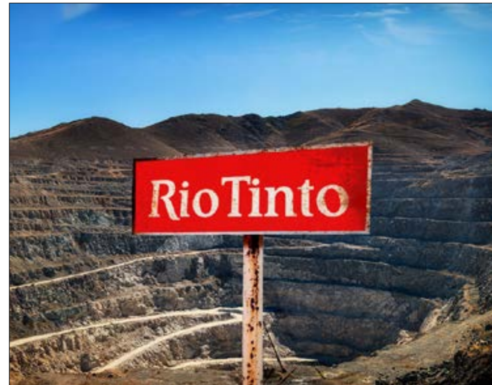
Rio Tinto PLC уволил одного из своих наиболее высокопоставленных операционных топ-менеджеров, а также главу юридического и регуляторного направления.