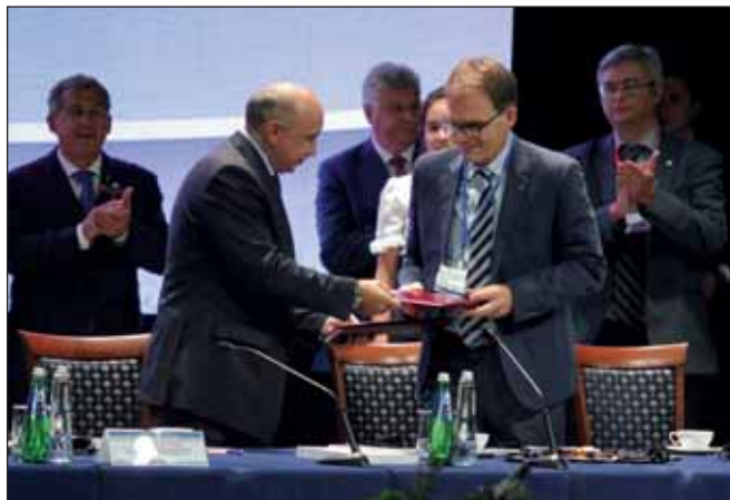
Подписание меморандума о сотрудничестве КФУ и КНИТУ с компанией Haldor Topsoe

Сотрудничество с КФУ предполагает, в частности, опытно-промышленную разработку катализатора дегидрирования, который является одним из важнейших компонентов для производства полимеров. В рамках проекта планируется проведение лабораторных исследований катализатора и его полупромышленное тестирование.