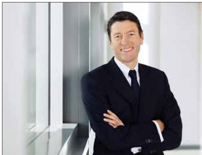
Каспер Рорштед, генеральный директор Henkel

В российском подразделении компании работает около 3 тыс. человек.