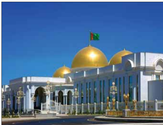
Концерн BASF усиливает свое присутствие в Центральной Азии

Концерн BASF официально открыл офис в республике Туркменистан. Отметим, что концерн уже реализует ряд успешных проектов на территории республики. Так, на газоперерабатывающем заводе на месторождении «Галкыныш», второе в мире по величине запасов природного газа, внедрено решение BASF OASE по газоочистке. Газоперерабатывающий завод, построенный компанией Petrofac (ОАЭ) на месторождении «Галкыныш», использует запатентованную технологию газоочистки