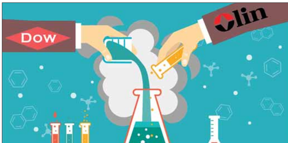
Dow Chemical и Olin Corporation объединяют хлорный бизнес

Dow Chemical — американская многоотраслевая химическая компания со штаб-квартирой в Мидлэнде, штат Мичиган. Является крупным производителем полимерной продукции, в том числе полистирола,