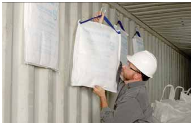
Сиккатив Container Dri II предназначен для защиты товаров от вредного влияния влажности и воды во время транспортировки контейнеров по морю, железной дороге или грузовым автотранспортом

В марте 2014 года Clariant открыла свой первый в Азии завод по выпуску продукции под маркой Container Dri II в Индонезии. Оба предприятия являются частью всемирной сети Clariant по производству сиккативов, куда также входят заводы в Бразилии, Турции и США. ■