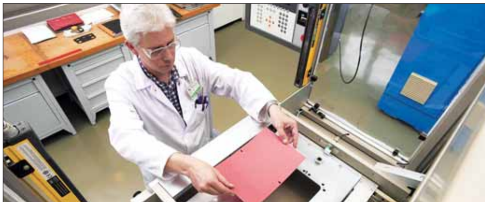
В 1 квартале 2015 года объем продаж концерна Bayer вырос на 14,8%

Чистая финансовая задолженность по сравнению с 31 декабря 2014 года выросла на 1,7 млрд евро и составила 21,3 млрд евро, в основном из-за