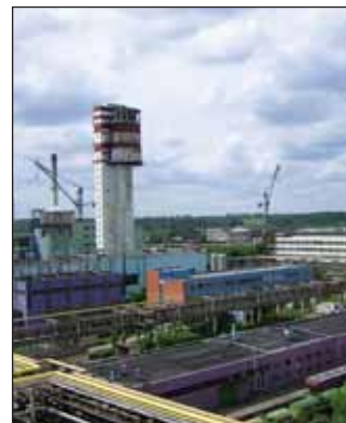
Завод удобрений Achema, Литва

потребителями для производства полимеров, в том числе полиэтиленовых пленок, термопластов, резины, ПВХ, а также в производстве труб и фармацевтической продукции. ■