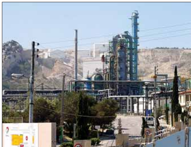
Нефтеперерабатывающий завод La Mede, Франция

Total, в свою очередь, продолжает корректировать собственную производственную базу во Франции. В частности, компания планирует сократить нефтеперерабатывающие и нефтехимические мощности на 20% в Европе к 2017 году.