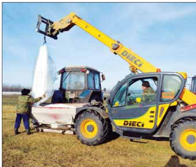
Проект постановления правительства РФ предполагает введение экспортной пошлины на минеральные удобрения с 1 марта 2015 года на уровне до 35 % в зависимости от вида удобрений

Федеральная антимонопольная служба (ФАС) России предложила четыре варианта решения вопроса с высокими ценами на минеральные удобрения на российском рынке, в том числе временную фиксацию цен и плавающую экспортную пошлину.