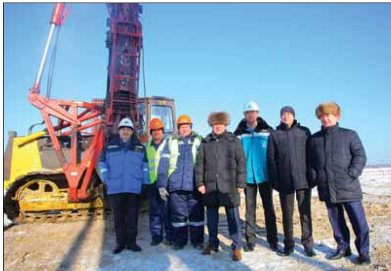
Состоялось открытие строительства комплекса «ЗапСибНефтехим»

В Тюменской области состоялось погружение первой сваи в основание «ЗапСибНефтехима», будущего комплекса глубокой переработки углеводородного сырья в полиолефины, строительство которого является крупнейшим инвестиционным проектом «Сибура».