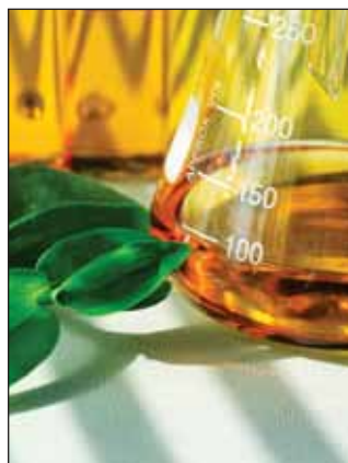
Биоэтанол в России скоро будет облагаться акцизом

Росалкогольрегулирование (РАР) вынесло на публичное обсуждение законопроект, вносящий поправки в отношении биоэтанола в ФЗ № 171, который регулирует оборот спиртосодержащей продукции на территории России.