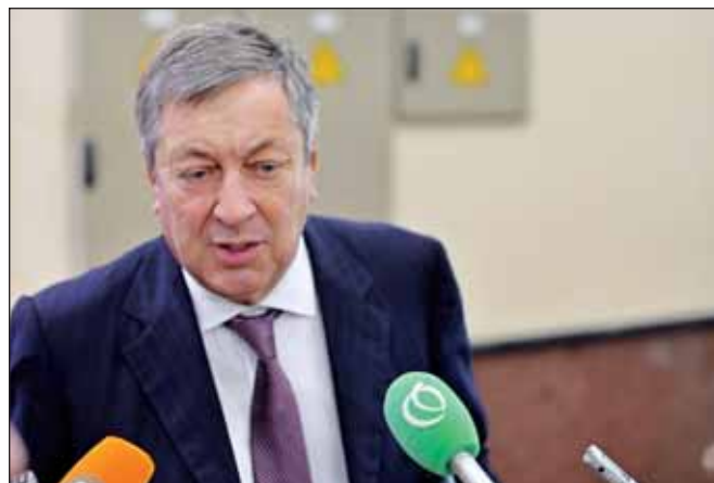
Владимир Школьник, министр энергетики Казахстана

В настоящее время на территории СЭЗ реализуется два якорных проекта, предполагающих углубленную переработку газа с месторождения Тенгиз. Первый: строительство интегрированного газохимического комплекса. Первая фаза проекта стоимостью 2 млрд долларов (30% — средства участников, 70% — заемные средства Экспортно-импортного банка Китая) будет завершена в 2018 году и позволит выпустить до 500 тыс. т полипропилена в год. На текущий момент получено заключение государственной экспертизы ПСД на производственные установки ИГХК. Также построены следующие объекты инфраструктуры: подъездная автодорога — выполнена на 100%; ж/д перегон между ст. Карабатан и ст. Заводской — выполнен на 100%; развитие ж/д станции Карабатан — на 100%; ж/д станция Заводская — на 98%; путепровод и объездная автодорога — на 100%. А также: линия электропередачи ПС-110/35/10 —