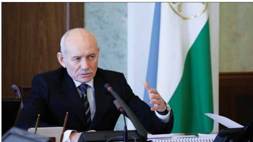
Рустэм Хамитов, глава Башкортостана, провел заседание правительственной комиссии по рассмотрению и поддержке приоритетных инвестпроектов

«Наши крупные предприятия подтормаживают инвестиционную деятельность. Очень слабо работала все последние годы «Башнефть» в части привлечения инвестиций. Дивиденды были высокими, а модернизация,