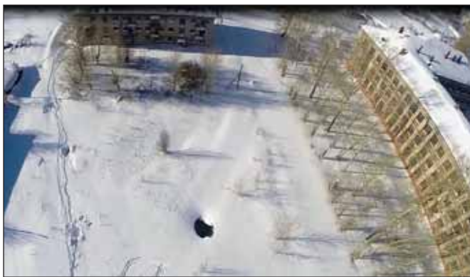
«Уралкалий» выявил новое проседание грунта в Березниках

«Уралкалий» обнаружил новый провал грунта диаметром около 5 метров на шахтном поле затопленного рудника БКПРУ-1 в Берез-