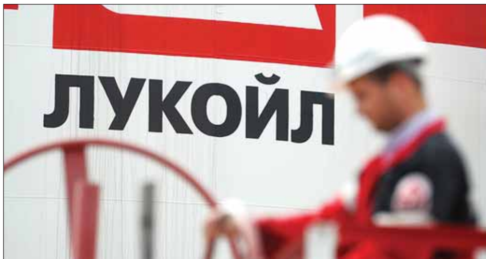
Работники «Карпатнефтехима» считают, что национализация предприятия, приватизированного компанией «Лукойл» в 2000 году, приведет к его полному банкротству

Несмотря на простой, работники завода получают зарплату и пользуются полным пакетом социальных гарантий, прописанных в коллективных соглашениях, подчеркивается в письме профсоюза. В феврале ситуация вокруг предприятия