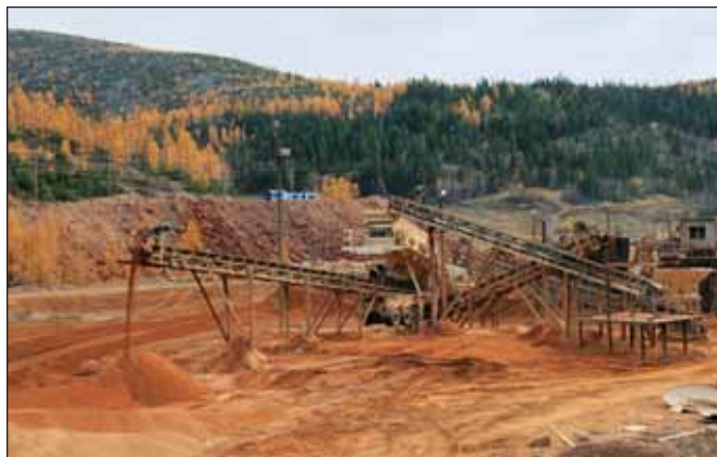
В этом году состоится аукцион на право разработки Селигдарского месторождения апатитовых руд в Якутии

в число приоритетных для развития Южной Якутии, несмотря на отсутствие недропользователя, относится к участкам недр федерального значения. Его запасы составляют около 1,3 млрд т апатитовой руды с 85,6 млн т оксида фосфора и свыше 4,4 млн т редкоземельных металлов. Стартовый платеж для будущего аукциона может составить 4,1 млрд рублей, тогда как параметры несостоявшегося в 2013 году конкурса предполагали плату в 10,5 млрд рублей. ■