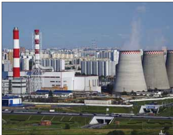
Доля импортного оборудования и материалов для ТЭКа в России должна к 2035 году быть снижена до уровня не выше 10% к 2035 году