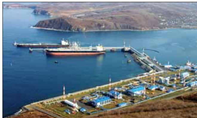
CNCEC примет участие в проекте производства минудобрений НХГ. Предприятие расположится вблизи порта Козьмино (г. Находка)

Первая очередь комплекса, включая объекты внешней инфраструктуры, оценивается НХГ в 240 млрд рублей. На финансирование объектов внешней инфраструктуры в размере 17 млрд рублей за счет бюджетных средств группа подала заявку в 2014 году.