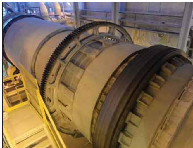
«Метахим» запустил под Волховом новое производство фосфатно-калийных удобрений мощностью 100 тыс. т в год

В России производится 18,3 млн т минеральных удобрений в год, доля экспорта составляет 70% объема производства.