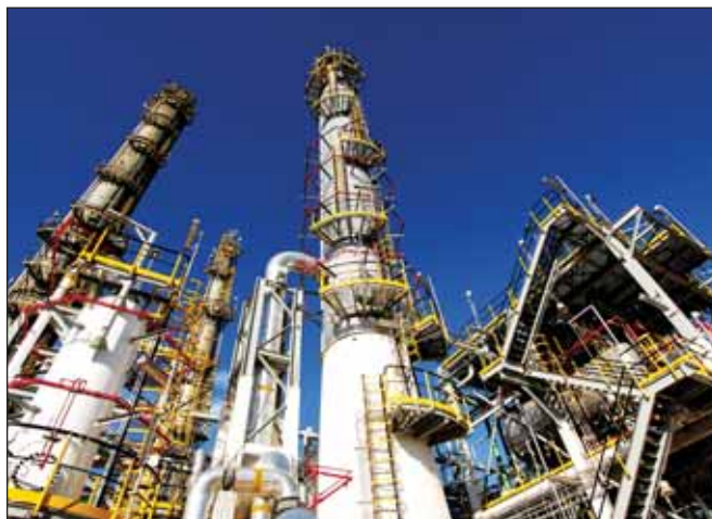
Мексиканская компания Alpek вышла из СП с Объединенной нефтехимической компанией по производству ТФК/ПЭТФ

Мощности нового завода должны быть 600 тыс. т ПЭТФ в год и такие же — сырья для ПЭТФ — терефталевой кислоты, что равно общему объему потребления ПЭТФ в России (примерно на 30% закрывается за счет импорта). Предварительный проект комплекса должен быть готов в 1 квартале 2015 года. Запуск планировался в 2017 году. Строительство комплекса включено в перечень приоритетных инвестиционных проектов Башкирии. ■