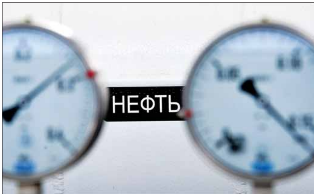
Уточнен порядок расчета ставок вывозных таможенных пошлин на нефть и нефтепродукты

Для предотвращения роста цен на внутреннем рынке предусмотрено постепенное сокращение ставок акциза на нефтепродукты (в 2,2