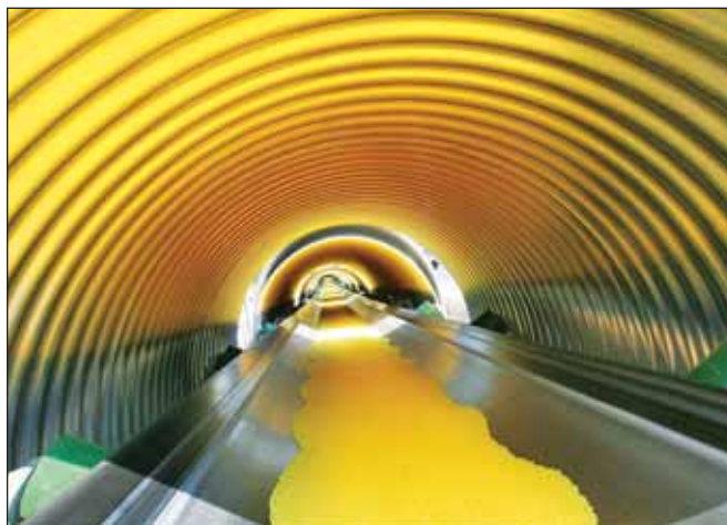
Суд поддержал предложенную ФАС формулу цены на серу жидкую