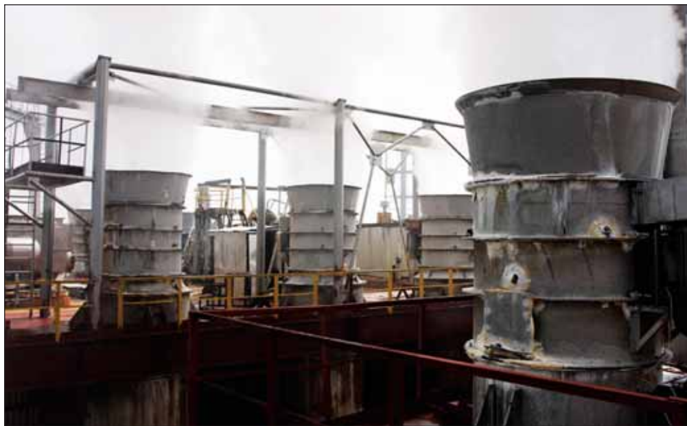
Завод «Воскресенские минеральные удобрения»

Параллельно у «Акрона» велись закупки излишек апатитового концентрата. На оферту «Уралхима» к «Фосагро», чтобы они поставляли в 2015 году 450 тыс. т, пришел ответ, что холдинг готов поставлять ежемесячно объемы, которые могут оказаться в излишке. «Это фактически