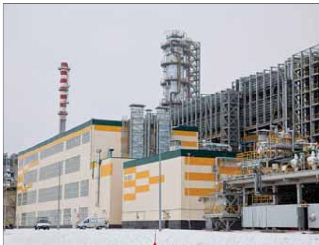
Новое производство компании «Танеко» запущено в Нижнекамске

2,9 млн т вакуумного газойля и производить 1,16 млн т дизельного топлива класса Евро-5, а также 500 тыс. т топлива для реактивных двигателей марок РТ, ТС-1, Джет А-1, более 600 тыс. т прямогонного бензина и гидроочищенного газойля, часть которого будет направлена на производство 190 тыс. т базовых масел. Пуск установки производства масел позволит предложить рынку высокоиндексные базовые масла III группы. Они станут основой для выпуска высокоиндексных моторных и трансмиссионных масел. ■