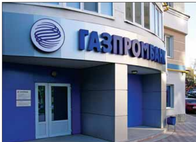
«Газпромбанк» потребовал от Ostchem Holding Дмитрия Фирташа срочно погасить кредит на 842,5 млн долларов

Компания Фирташа должна погасить задолженность до 30 декабря 2014 года. В противном случае «Газпромбанк» предъявит требование по погашению кредита к поручителям — четырем заводам по производству минеральных удобрений, входящим в группу компаний Ostchem. Кроме того, банк пригрозил наложить взыскание на предоставленное заводами обеспечение — залог в 5,679 млрд куб. м газа в подземных газовых хранилищах на Украине. ■