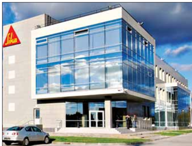
Выручка швейцарской Sika в России составила более 2 млрд рублей

С января по сентябрь 2014 продажи глобального химического концерна Sika выросли на 16 % в местных валютах и составили 3,5 млрд евро. Чистая прибыль увеличилась на 21 %, до 258 млн евро. За первые три квартала текущего года были построены 6 заводов в Бразилии, Индонезии, Индии и Сербии, а также приобретены три компании в Бразилии, Южной Корее и Швейцарии с общим оборотом 44 млн евро.