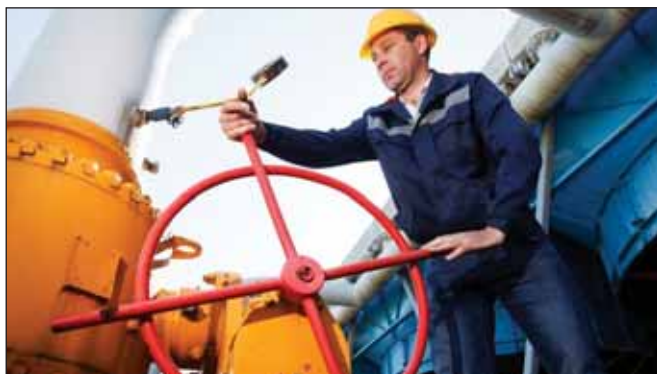
Суд счел незаконной монополизацию рынка газа Украины

Производитель минеральных удобрений «ДнепрАзот», принадлежащий группе «Приват», ранее также подавал в суд иск о признании незаконным постановления кабинета министров, которым правительство расширило список потребителей газа и обязало уже 150 крупнейших предприятий покупать газ только у «Нафтогаза». Однако 5 декабря суд отказал «ДнепрАзоту» в ходатайстве, которым химзавод просил на время рассмотрения дела приостановить действие постановления. «ДнепрАзот» покупает газ у госкомпании «Укрнафта», которой управляет топ-менеджмент группы «Приват».