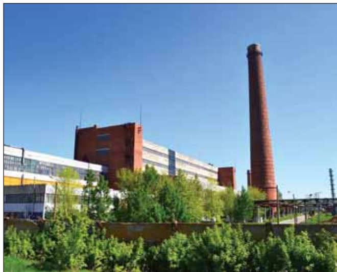
ОАО «Химпром», Новочебоксарск