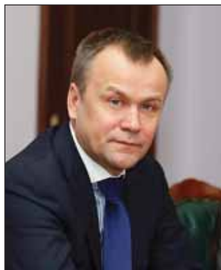
Сергей Ерошенко, губернатор Иркутской области

В Иркутской области формируются четыре территории опережающего развития (ТОР), которые позволят решить проблему моногородов региона. Среди них газохимический комплекс Саянск — Усолье — Ангарск, создание которого начнется в 2015 году, сообщил губернатор Сергей Ерошенко.