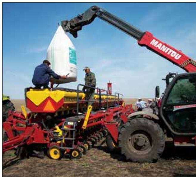
Российские производители минудобрений, пытаясь поддержать спрос, объявили о скидках для сельхозпредприятий в размере 10–15%