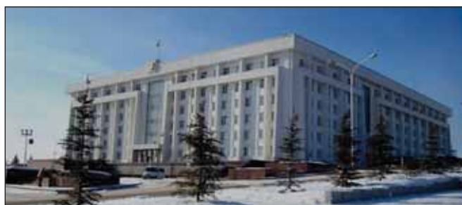
Власти Башкирии намерены привлечь на развитие нефтехимии 52 млрд рублей

Среди участников кластера упоминаются градообразующие предприятия Уфы, Стерлитамака, Салавата, Ишимбая, Октябрьского. ■