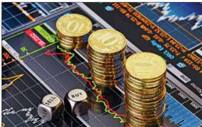
«Уралхим» с октября 2014 года продал 50 % своей валютной выручки

Холдинг «Уралхим» добровольно поддержал инициативу правительства по продаже валютной выручки крупными экспортерами, продав на внутреннем рынке валюту на сумму около 320 млн долларов.