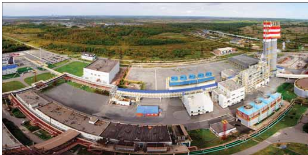
Производство ОАО «Фосагро-Череповец». «Фосагро» инвестирует 2,7 млрд рублей в новое производство сульфата аммония в Череповце

Ввод в строй нового производства запланирован на 2017 год. Общий объем