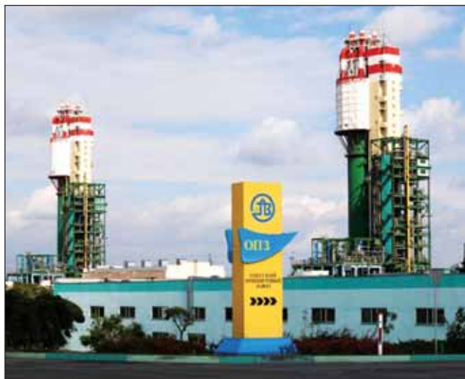
Кабмин Украины поручил Ощадбанку выдать кредит ОПЗ в 5 млрд грн для закупки газа у «Нафтогаза»

Кабинет министров Украины поручил крупнейшему государственному Ощадбанку предоставить Одесскому припортовому заводу кредит в объеме 5 млрд грн (более 15 млрд рублей) сроком на год для закупки природного газа, необходимого для стабильной работы предприятия.