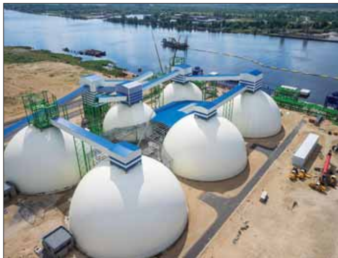
Терминал по перевалке и краткосрочному хранению сыпучих минеральных удобрений Riga fertilizer terminal

ОХК «Уралхим» прогнозирует увеличение загрузки рижского терминала по перевалке и краткосрочному хранению сыпучих минеральных удобрений Riga fertilizer terminal до 27% в 2015 году.