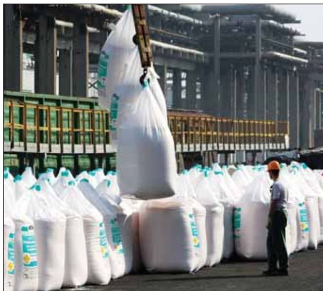
В 2015 году доля экспорта в секторе минудобрений увеличится, так как рост доллара делает экспорт более выгодным