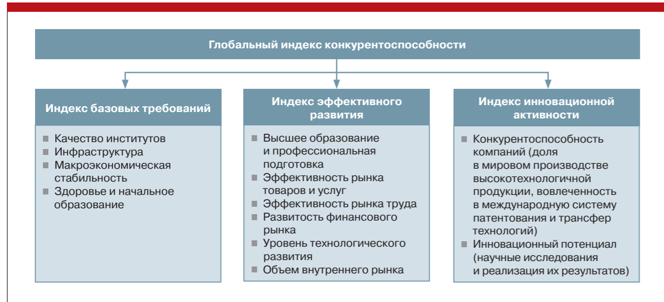
Диаграмма 1. Составные части Глобального индекса конкурентоспособности

интенсификацией производства: позитивными структурными сдвигами, технологическим обновлением, повышением производительности труда.