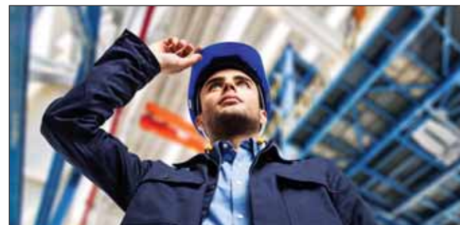
Сбербанк России выделит 2 млрд евро для строительства нового комплекса на «Нафтано»

этом принципиальная готовность выделить средства со стороны Сбербанка имеется.