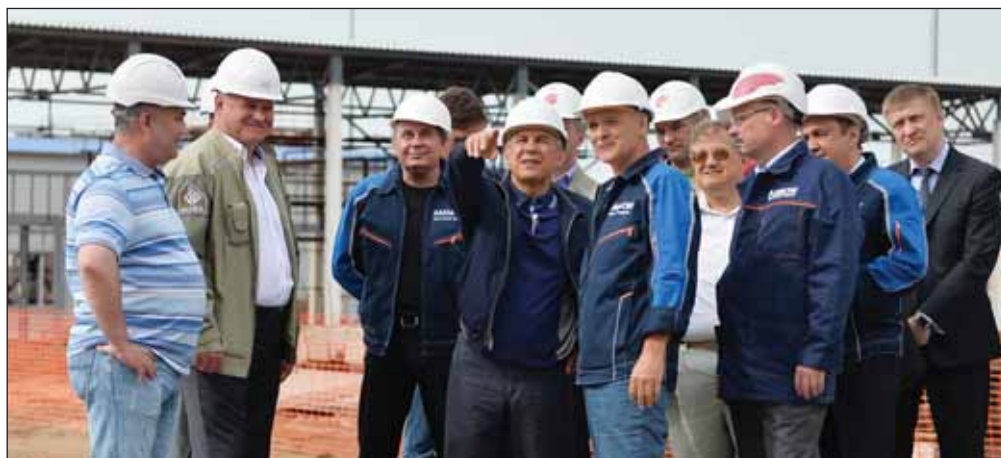
Рустам Минниханов, президент Республики Татарстан, на строительной площадке завода «Аммоний»

В ходе совещания Р. Минниханов еще раз акцентировал внимание на том, что запустить завод необходимо в августе 2015 года. Он призвал активизировать работу в летний период.