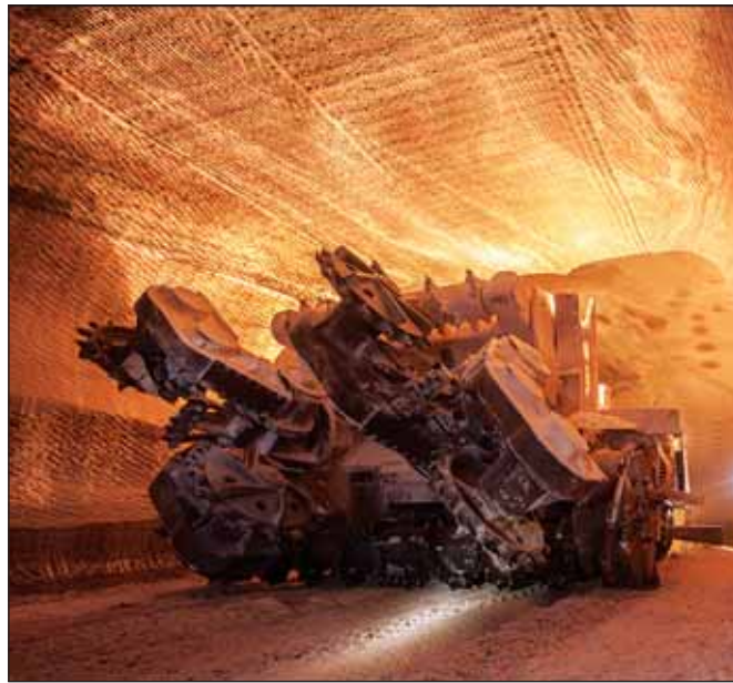
Приволжскнедра заканчивают прием заявок на участие в аукционах по добыче калийно-магниевых солей на Верхнекамском месторождении

ООО «Еврохим-Усольский калийный комбинат» (входит в холдинг «Еврохим») и ЗАО «Новая химическая компания «Новохим» подписали договоры задатка для участия в аукционе на право пользования двумя участками Верхнекамского месторождения калийно-магниевых солей в Пермском крае. Департамент по недропользованию Роснедр по Приволжскому федеральному округу (Приволжскнедра) проведет аукцион на право пользования двумя участками Верхнекамского месторождения калийно-магниевых солей 23 июня. Заявки принимаются до 30 мая. Белопашнинский участок расположен на юге месторождения, он примыкает на севере к Усть-Яйвинскому участку «Уралкалия», на