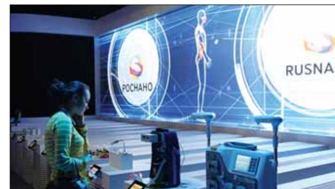
Убыток «Роснано» по сравнению с предыдущим годом увеличился на 82%

на 6% больше, чем на конец 2012 года. Долгосрочные обязательства (в основном кредиты и займы) в отчетный период достигли 113 млрд 193 млн рублей (+8%).