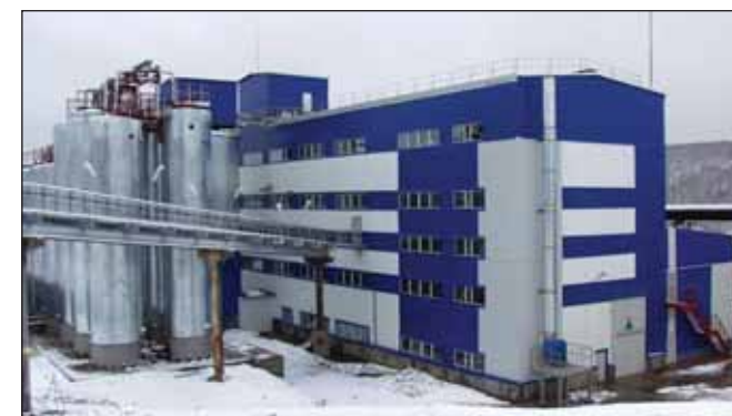
Производство ООО «Метадинеа» (г. Губаха)

Совет директоров компании рассмотрит решение о строительстве на подмосковной площадке «Метадинеа» нового производства формалина. Строительство второго агрегата формалина