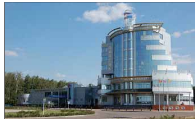
ОЭЗ ППТ «Липецк»

ке сам завод мощностью 25 тыс. т продукции в год, склад готовой продукции, технические лаборатории и административный комплекс. Ожидается, что предприятие будет поставлять продукцию судостроительным и автомобильным заводам, в том числе Краснинскому заводу (Липецкая область), где работает цех покраски внедорожников и микроавтобусов Great Wall Hover.