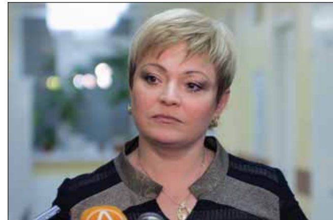
Марина Ковтун, ВРИО губернатора Мурманской области

аммиака и производств удобрений. Проект интересен тем, что интеграция на одной площадке ОАО «Апатит» производств по выпуску высококачественного фосфатного сырья и его переработки в минеральные удобрения, а также близость к порту Мурманск с незамерзающей акваторией, дадут определенный синергетический эффект. Общая потребность «Фосагро» в природном газе (с учетом текущих потребностей ОАО «Апатит») в случае реализации данного проекта оценивается примерно в 1,2 млрд куб. м в год. ■