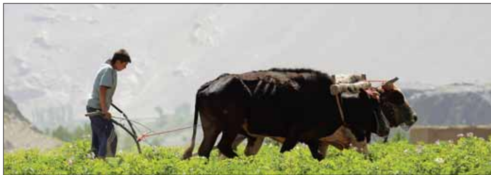
ЗАО СП «ТаджикАзот» единственное предприятие Таджикистана, выпускающее азотные удобрения (карбамид) для нужд сельского хозяйства

Агентство по государственному финансовому контролю и борьбе с коррупцией Таджикистана считает приватизацию предприятия незаконным и требует аннулировать соответствующие соглашения. В марте текущего года