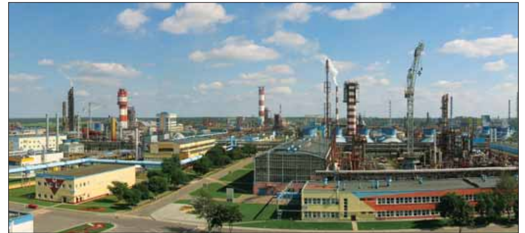
Производство ОАО «Гродно Азот». Интерес к участию в инвестировании в белорусское предприятие проявляют компании «Роснефть», «Газпром» и «Еврохим»

Условием конкурсного отбора является внесение инвестором в порядке и сроки, установленные инвестиционным договором, в уставный фонд «Гродно Азот» не менее 440 млн долларов путем приобретения дополнительно выпускаемых акций данного ОАО по их рыночной стоимости на 1 января 2014 года, в количестве, позволяющем инвестору иметь в собственности не более чем 50% плюс 1 акция уставного фонда предприятия, с направлением этих средств на модернизацию производства. Также инвестор должен гарантировать работникам «Гродно Азот» и унитарных предприятий, учредителем которых он является, что их социальные и материальные условия, предусмотренные трудовыми договорами (контрактами) и коллективными договорами, не ухудшатся. Инвестор обязан будет в течение пяти лет с даты заключения договора купли-продажи акций обеспечивать сельское хозяйство страны азотными удобрениями в объемах, ежегодно согласуемых Минсельхозпродом, и по цене, обеспечивающей рентабельную работу предприятия и его развитие. Также инвестору надо будет заключить с государством в лице Минэкономики инвестиционный договор