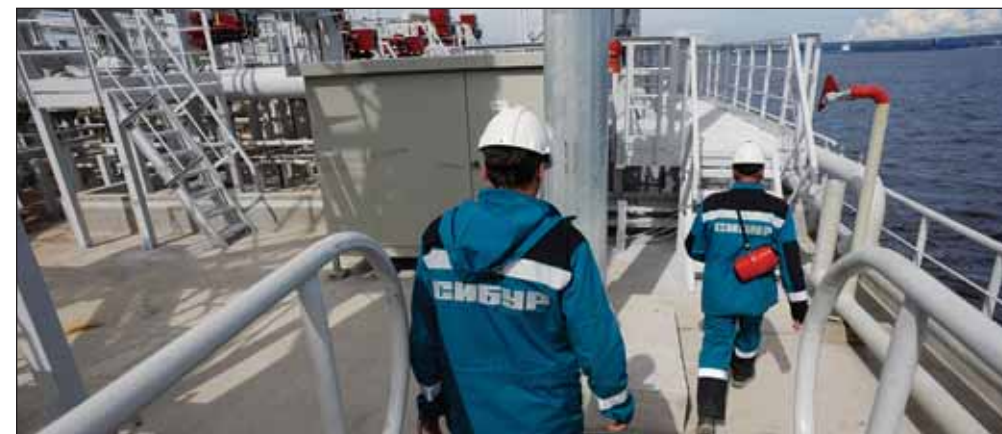
«Сибур» отдал терминал в Усть-Луге РФПИ, «Газпромбанку» и иностранным инвесторам, чтобы вернуть деньги, потраченные на строительство

Сооружение основных мощностей терминала и сопряженной железнодорожной и морской инфраструктуры комплекса «Сибура» в Усть-Луге было завершено в 2013 году. В настоящее время комплекс работает с целевой загрузкой на уровне до 1,5 млн т СУГ и до 2,5 млн т светлых нефтепродуктов. Параллельно проводятся работы по оптимизации эксплуатационных характеристик и проектированию плана оперативного расширения мощностей терминала по всем видам переваливаемых продуктов. Терминал является проектом федерального значения и был построен в координации с государственной программой по развитию морских портовых мощностей на северо-западе России.