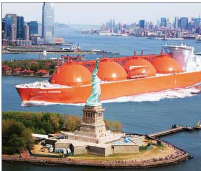
Затраты на тонну этилена в США составляют 200 долларов против 1000 долларов в России

газа в объемах, необходимых для поставки в Европу, мировые мощности по производству криогенной стали нужно увеличить в пять раз, что вряд ли реализуемо в короткое время. При этом Михаил Юрьев отметил, что американцы способны «надавить» на Катар, чтобы он нарастил добычу и экспорт газа, а также обеспечить режим максимального благоприятствования для наращивания добычи газа Ирану. Но, так или иначе, независимо от географии, строительство большого завода по сжижению займет 5–7 лет. Это не считая времени на наращивание добычи. Так что угрозы поставки газа, а не его производных, на европейский рынок, относятся к 2020-м годам, а не 2010-м, считает Михаил Юрьев.