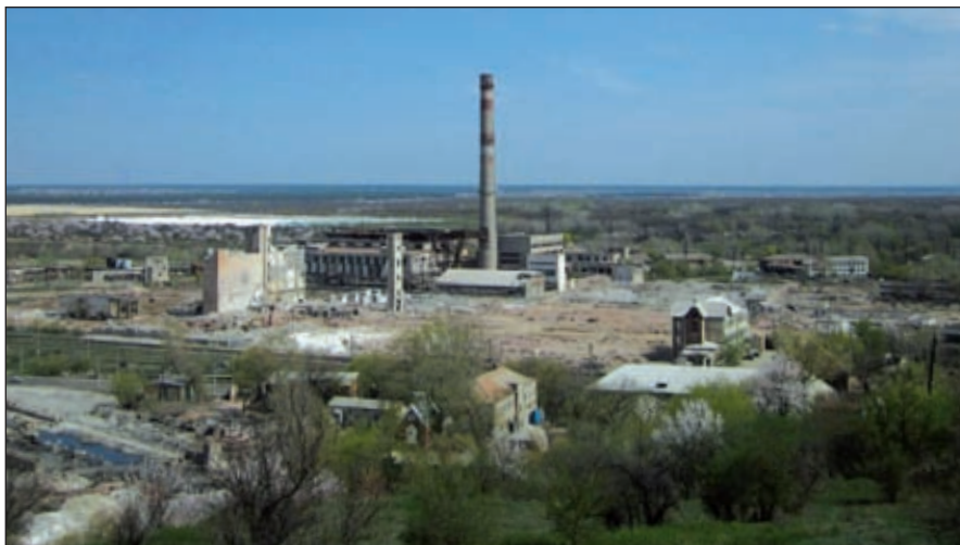
Общий вид предприятия «Лисичанская сода» после демонтажа, декабрь 2013 года