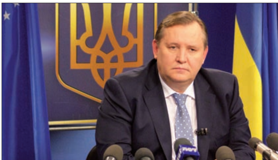
В декабре 2013 губернатор Луганской области Владимир Пристюк заявил, что ведутся переговоры о преобразовании Лисичанского содового завода в цементный завод

рая специализируется на демонтаже промышленных объектов. Всего от продажи имущества предприятия было выручено около 55 млн гривен, большая часть которых пошла на удовлетворение требований близкой к «Бинбанку» (последнему собственнику завода) компании «Авилон» (более 40 млн гривен). Другим кредиторам не повезло, поскольку никакого имущества у должника не осталось, суд списал почти 175 млн гривен долгов завода из общей суммы его задолженности перед кредиторами, утвержденной в 2010 году на уровне 230 млн гривен.