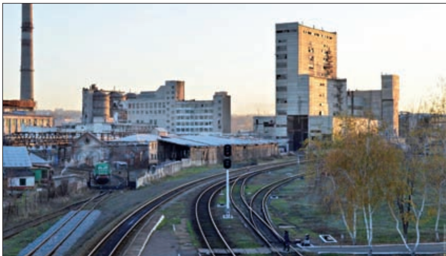
Общий вид предприятия «Лисичанская сода», 2012 год. С 1991 по 2009 годы предприятие работало с перебоями, а с 2010 года перестало функционировать окончательно