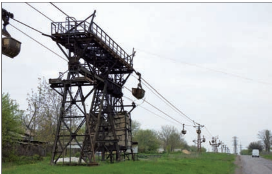
Лисичанская воздушная канатная дорога, в настоящее время демонтирована

Однако «Лиссода» по решению местных властей была продана без входящей в ее производственный комплекс ТЭЦ. А «Лисичанская ТЭЦ» является по сути технологической ТЭЦ содового завода, так как 95 % ее мощностей используется именно для выработки пара непосредственно для предприятия.