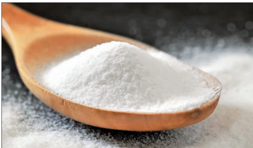
С 2009 по 2013 год украинская промышленность не производила пищевую соду, поскольку единственный в Украине производитель ОАО «Лисичанская сода» прекратил работу. Львиная доля пищевой соды импортировалась производителями из трех стран – России, Турции и Китая