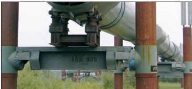
«Метафракс» увеличит закупки газа до 1,6 млрд куб. м в год

«Метафракс» бронирует дополнительные объемы газа для крупного инвестиционного проекта — строительства установки по производству карбамида или метанола.