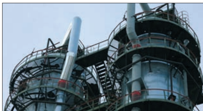
Производство УК «Санорс»

Совет директоров ООО СУК «Санорс» принял решение о выборе технологии и реализации проекта строительства производства метилметакрилата (MMA) на территории холдинга. Проектная мощность нового производства составляет 70 тыс. т в год. По данным компании, инвестиции в проект не превысят 5 млрд рублей. Строительство завода планируется завершить в 2015 году. ■