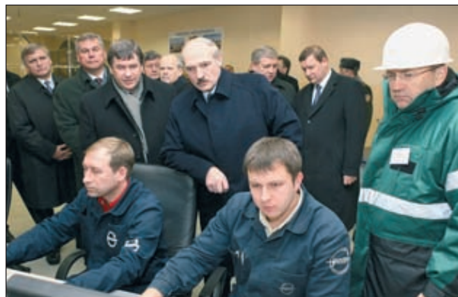
Александр Лукашенко во время посещения ОАО «Нафтан»

В 2012 году будут завершены такие крупные проекты, как строительство третьей очереди Краснослободского рудника, реконструкция цеха «Карбамид-4» в ОАО «Гродно Азот», в 2013 году — первая очередь химического комбината по глубокой комплексной переработке хлорсодержащего минерального сырья в «Беларуськалий», реконструкция производства капроновой и кордной