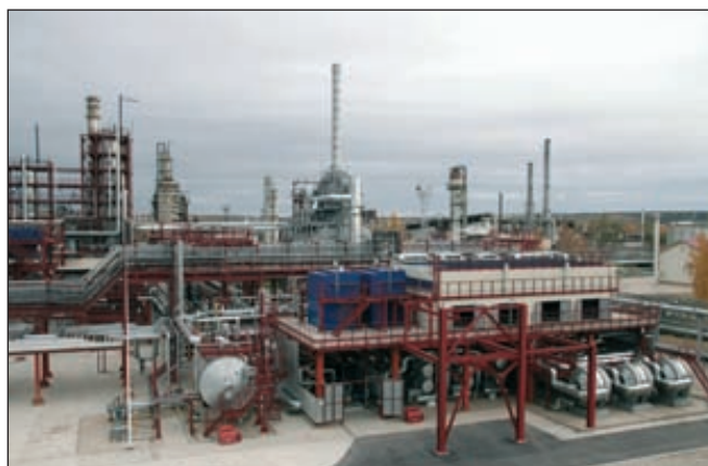
Производство ООО «Омск-Полимер»

ООО «ГринЛайт» занимается оптовой продажей полистирола и полипропилена (оборот за 2 квартал 2012 года — 300 млн рублей). На сегодня это первый производственный актив данной столичной компании. ■