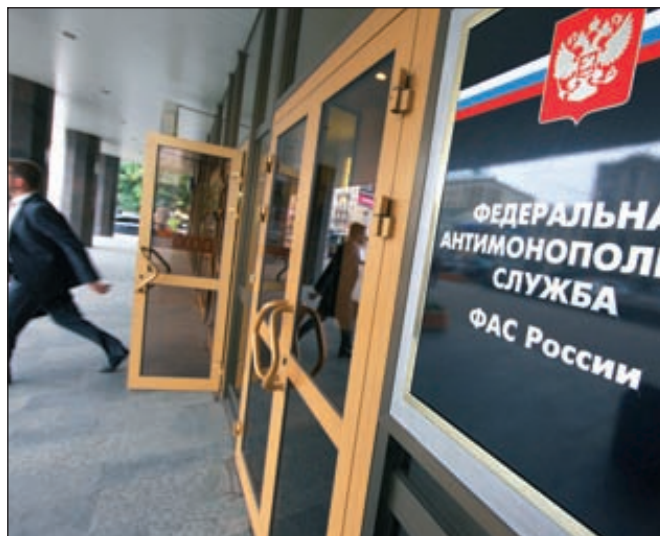
В декабре 2011 года ФАС России признала 23 участника рынка жидкой каустической соды РФ нарушившими закон «О защите конкуренции»

«Химпром», ОАО «Сибур-Нефтехим», ЗАО «Хлорактив», ООО «Бекборн», ОАО «Единая торговая компания». Ведомство решило, что конкуренты заключили и участвовали в соглашении, которое привело к установлению и поддержанию цен на оптовом рынке жидкой каустической соды, к разделу товарного рынка по объему продаж товара, составу продавцов, покупателей и территориальному принципу, а также экономически и технологически необоснованным откзам в договорах с покупателями продукции. В июне 2012 года Главное следственное управление МВД России по Москве возбудило уголовное дело в отношении лиц, создавших картель.