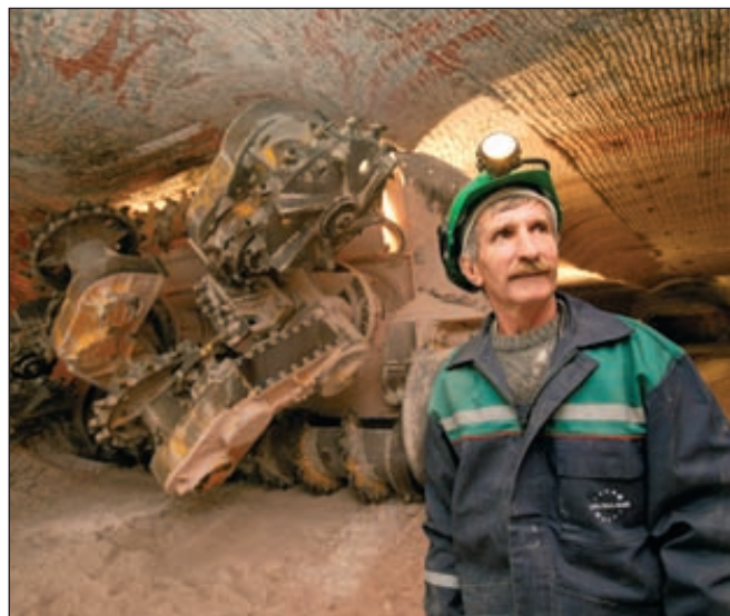
Отечественные производители сложных минеральных удобрений получили 457 млн рублей

финансирования на сумму 205 млн долларов. Координирующими организаторами синдицированного кредита выступают The Bank of Tokyo-Mitsubishi UFJ Ltd. и Sumitomo Mitsui Banking Corporation Europe Ltd. DZ Bank AG Deutsche Zentral-Genossenschaftsbank, Natixis и ЗАО «Торгово-промышленный банк Китая» (Москва). Natixis выступил в роли агента по кредиту и обеспечению. Ставка по кредиту составила одномесячный LIBOR +2,5%, срок кредита — 5 лет. Привлеченные кредитные средства будут направлены на финансирование текущей деятельности «Уралкалия». ■