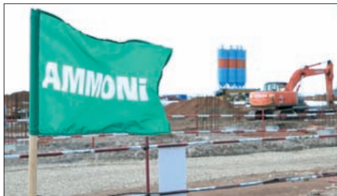
Строительство химзавода «Аммоний», Менделеевск