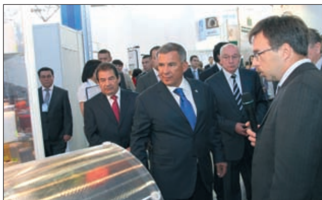
Посещение Президентом РТ экспозиций выставки «Нефть, газ. Нефтехимия-2012»

В рамках проходившей в Казани международной выставки «Нефть, газ. Нефтехимия» состоялось собрание межправительственной комиссии по торгово-экономическому сотрудничеству Татарстана и Азербайджана. Была достигнута договоренность о том, что специалисты в области проектирования, эксплуатации и ремонта нефтегазового оборудования из Азербайджана пройдут стажировку на предприятиях ОАО «Казаньоргсинтез» и ОАО «Нижекамскнефтехим».