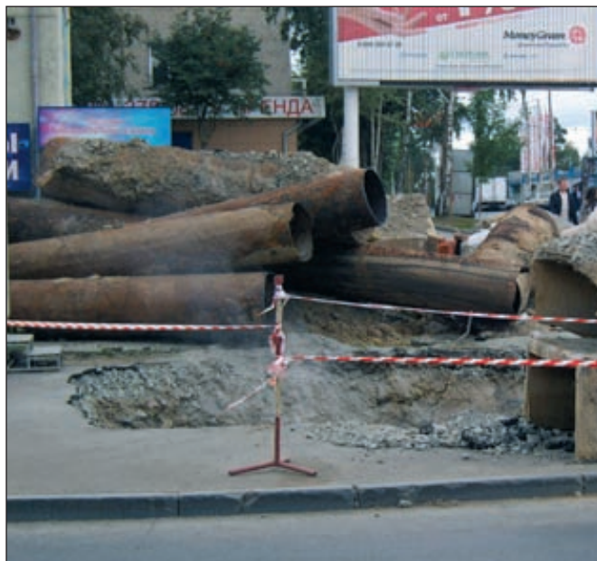
В настоящее время износ основных фондов ЖКХ (котельные, электрические сети, канализации) в среднем по России превышает 60 %

Российское правительство решило урезать расходы на реформу жилищно-коммунального сектора. Фонду ЖКХ, который теперь занимается реформированием жилищно-коммунального хозяйства, в 2013–2015 годах выделят вместо запланированных в рамках программы 50 млрд рублей 15 млрд рублей. В то же время, по оценке экспертов, всего на обновление российской инфраструктуры ЖКХ требуется около 6 трлн рублей, то есть примерно в 420 раз больше денег, чем намечено выделить в 2013–2015 годы.