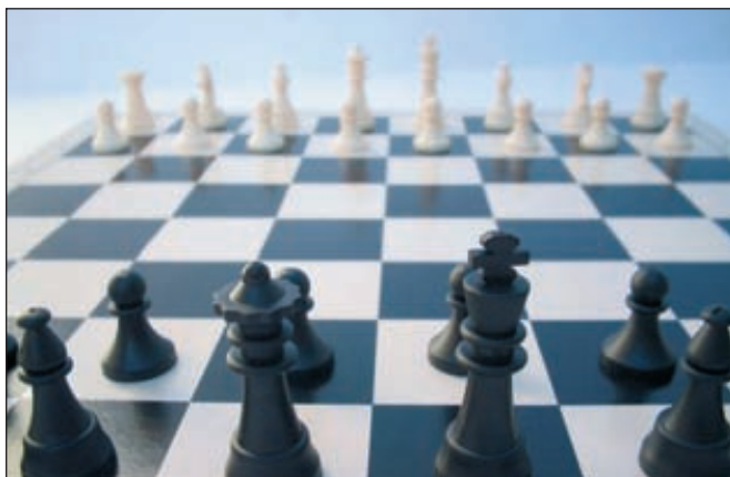
«Фосагро» выиграл битву за «Апатит»

Один из двух участников торгов по продаже 20 % государственных акций «Апатита» — холдинг «Фосагро» — сообщил, что объявил «наивысшую из всех участ-