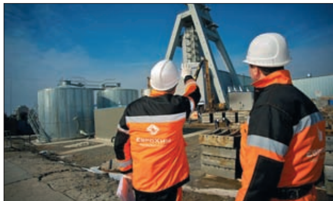
«Еврохим» перенес начало производства на «Волгакалии» на 2015 год

Пока монополистом на рынке калийных удобрений является компания «Уралкалий», которая в прошлом году произвела 10,8 млн т хлористого калия. ■