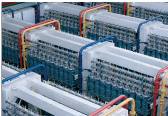
Завод разделения изотопов ОАО «Сибирский химический комбинат»