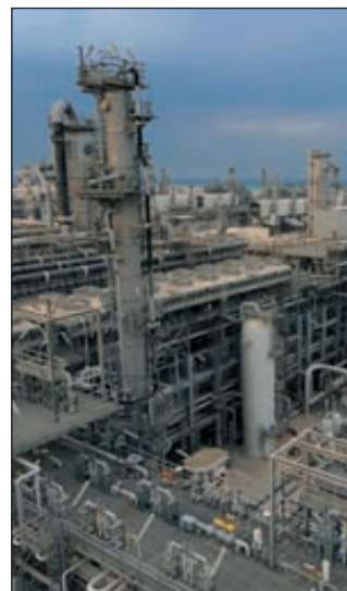
В Катаре большие запасы природного газа, поэтому индустрия удобрений в стране процветает

карбамида — 5,6 млн т (–5,5%). Из законтрактованных объемов по договорам с крупными международными производителями отгружено в среднем 75% продукции. ■