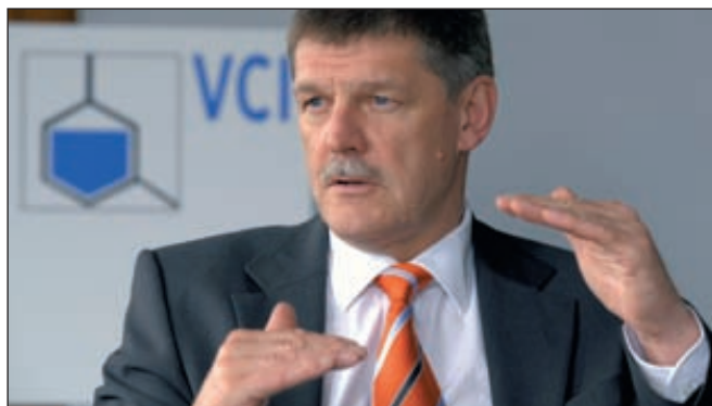
Утц Тиллман, председатель VCI, немецкой ассоциации химпромышленности

ции, тесное взаимодействие с научными центрами, следование мировым трендам, стабильность экономики в целом. При этом для немецкой химической промышленности сохраняются риски в виде роста цен на сырьевые материалы и продолжающуюся неопределенность в ЕС в связи с кризисом. Кроме того, по его мнению, в дальнейшем невозобновляемые источники энергии окажут сильнейшее влияние на индустрию в целом.