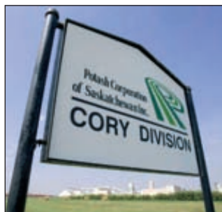
Potash Corp, Саскачеван (Канада)