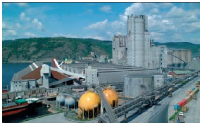
Производство компании Yara, Порсгрунн (Норвегия)

Во 2 квартале значительно выросли производственные и финансовые показатели крупнейшего европейского производителя азотных удобрений норвежской компании Yara.