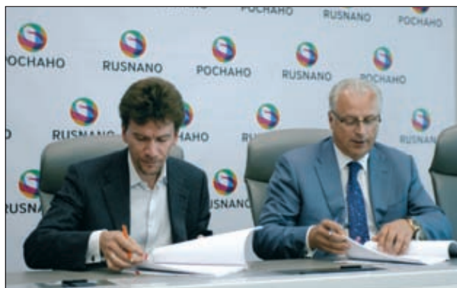
Подписание инвестиционного соглашения о создании наноцентра «Т-Нано» в Москве

«Т-Платформы» — разработчик суперкомпьютеров и поставщик полного спектра решений и услуг для высокопроизводительных вычислений. Компания «Т-Платформы» создана в 2002 году и сегодня имеет центральный офис в Москве, а региональные штаб-квартиры в Ганновере (Германия), Тайбее (Тайвань) и Гонконге (Китай).