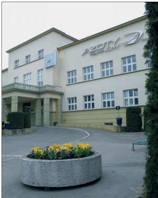
Azoty Tarnow, Польша

«Акрон» по итогам реализации оферты выкупит 7,715 млн акций польской химической компании Azoty Tarnow, что составляет 12,03 % от ее уставного капитала.