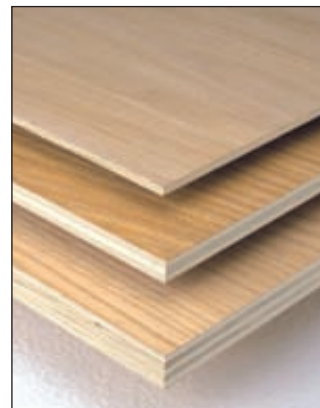
«Трансхимсервис» откроет завод по производству фенольной пленки

Ожидается, что объем выпуска пленки в ближайшие два года может быть доведен до 34 млн кв. м в год. ■