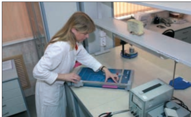
Испытательный центр ОАО «НИИК»

Компания применяет трехмерное проектирование, внедряет программный комплекс Multi-D.