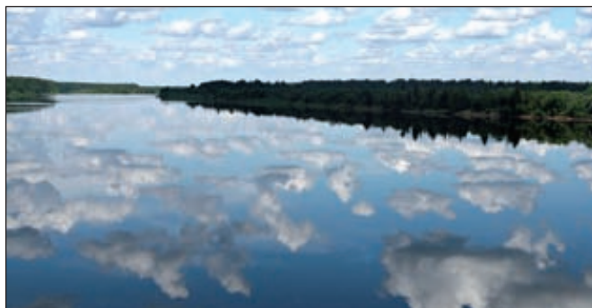
28 августа 2012 года пройдет конференция «Региональная система водоснабжения. Опыт внедрения новых технологий»

Заявленные доклады: МГУП «Мосводоканал», МУП «Уфаводоканал», группа «Полипластик», НИИЦ «Синтез», ООО «Башрезинотехника», компания BASF, группа «Полимертепло», ООО НПК «Кремнегран», ЗАО «Опытный завод Нефтехим» и другие.