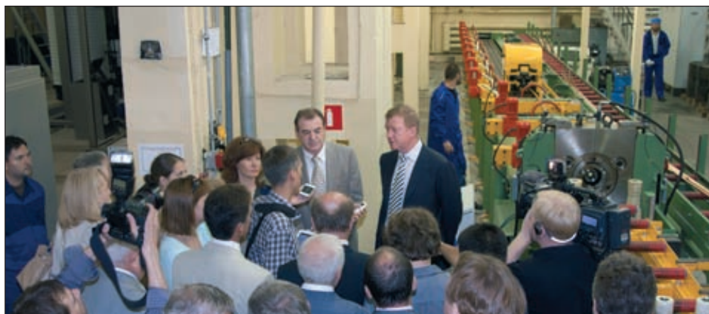
«Роснано» будет производить наноструктурные суперпровода

К классу суперпроводов относят провода, прочность которых сравнима с прочностью стали, а электропроводность составляет от 40 до 80% от величины электропроводности чистой меди. Целевым сегментом рынка для проекта являются провода для специальных применений с повышенными требованиями к сочетанию этих двух параметров. Высокая прочность проводников, выпускаемых проектной компанией, обусловлена наличием в их структуре ниобиевых проволок толщиной 6–10 нанометров, а проводимость — высоким содержанием меди. Продукция проекта может быть использована в мощных импульсных магнитах для