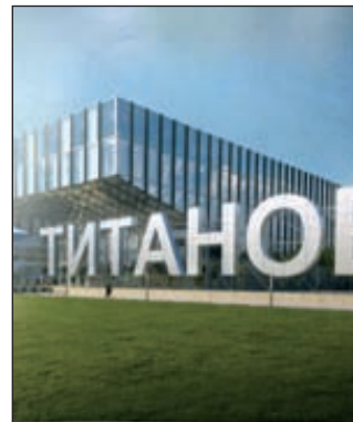
В ОЭЗ «Титановая долина» зарегистрированы два резидента

Проект особой экономической зоны, стартовавший в мае 2012 года, рассчитан на 50 резидентов, которыми будет создано 10 тысяч рабочих мест. Для участия в «Титановой долине» привлекаются предприятия машиностроения, механообработки, авиостроения, стройиндустрии, а также химической и фармацевтической промышленности.