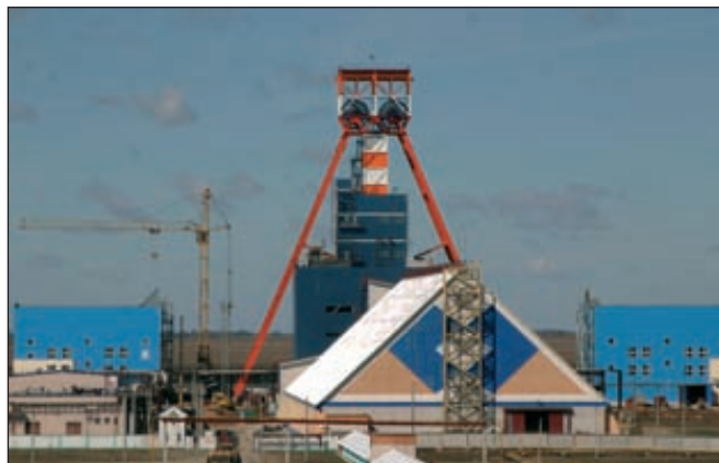
Производство ОАО «Беларуськалий»

реработку, получение продукции и отгрузку. В итоге на Петриковском месторождении калийных солей появится второй город шахтеров со своим предприятием.