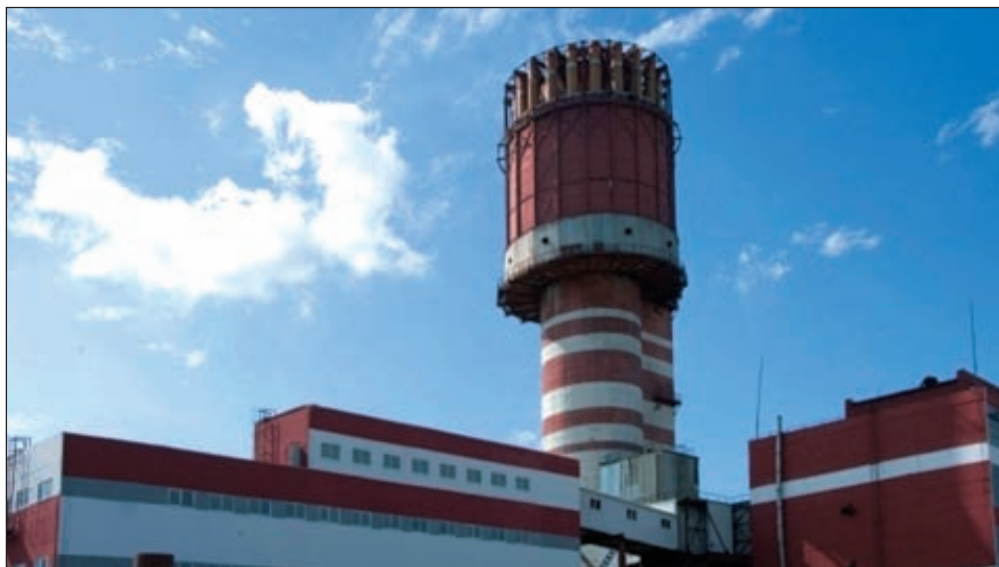
Производство ОАО «Акрон»

В связи с решением общего собрания акционеров ОАО «Акрон» о реорганизации ОАО «Акрон» в форме присоединения его дочернего общества ЗАО «Гранит» и уменьшении уставного капитала компании, а также в связи с последующим прекращением деятельности ЗАО «Гранит», являвшегося поручителем по облигациям серий 02 и 03, владельцы облигаций ОАО «Акрон» серий 02, 03, 04 и 05 получили право предъявить облигации к досрочному погашению.