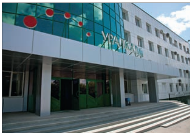
ОАО «Уралкалий» присоединил к себе дочерние структуры

В ближайшее время ожидается регистрация присоединения ОАО «Камская горная компания», ранее принадлежавшего ЗАО ИК «Сильвинит-Ресурс», к ОАО «Уралкалий», в результате чего реорганизация компании будет полностью завершена. ■