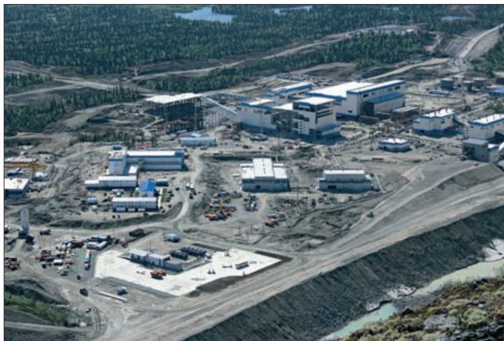
Панорама промплощадки ГОК Олений ручей. Июнь 2012 г.

На сегодняшний день среди крупных производителей без собственного сырья остаются только «Уралхим» Дмитрия Мазепина и россшанские «Минудобрения» Аркадия Ротенберга. Они покупают примерно 1 млн т и 500 тыс. т концентрата в год соответственно. ■