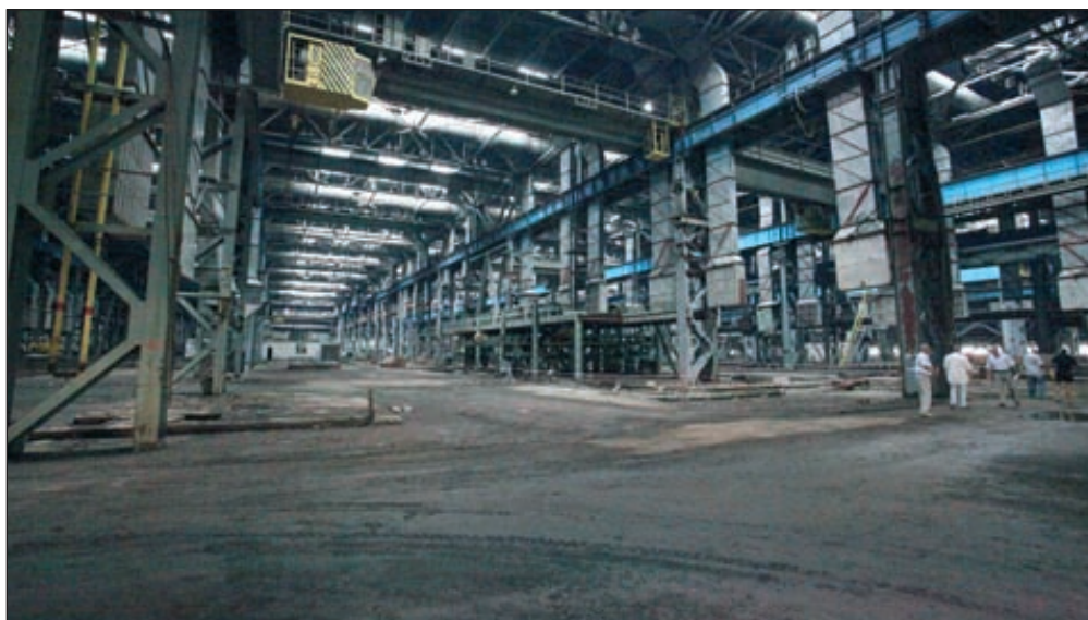
Корпуса завода «Крастяжмаш», в которых после реконструкции планировалось разместить Енисейский ферросплавный завод, простаивают с 1992 года

Продолжаются споры вокруг строительства Енисейского ферросплавного завода, принадлежащего компании ЗАО «Чек-Су.ВК». Предприятие строится в 20 км от Красноярска на базе бывшего оборонного предприятия «Крастяжмаш» и, по замыслу инвесторов, впервые в постсоветской России должно производить ферромарганец из отечественного сырья. Запустить предприятие планировалось в 2013 году. Однако у строительства есть активные противники. Так, 22 июня в Красноярске у городского Дворца культуры более полутора тысяч местных жителей, заявляя об экологической опасности производства, выступили против открытия завода.