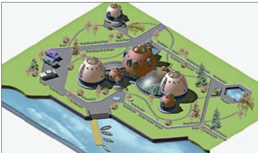
«Новое село — новая цивилизация» — победитель проектов развития территорий. Необходимый объем инвестиций, по подсчетам разработчиков, составляет 1,2 млрд рублей со сроком окупаемости от 3 до 5 лет