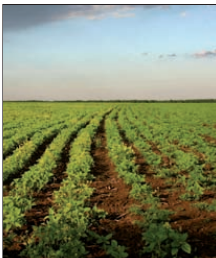
На земельных угодьях планируется засеять картофель на паровых полях, без применения минеральных удобрений и ядохимикатов