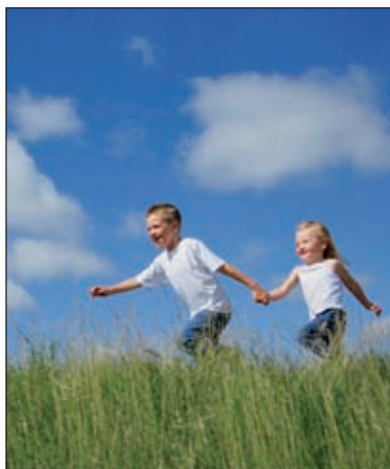
В случае реализации проекта «Новое село — новая цивилизация» число жителей увеличится с 1400 до 6000 человек