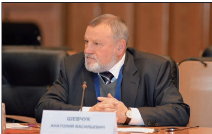
Анатолий Шевчук, зампредела СОПС Минэкономразвития России и РАН по вопросам экологии и природопользования

Анатолий Шевчук , зампредела СОПС Минэкономразвития России и РАН по вопросам экологии и природопользования