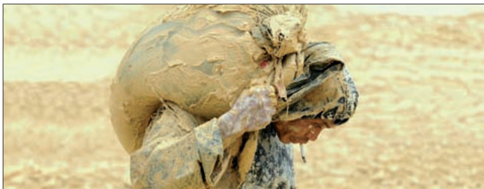
Китай добывает 97% редкоземельных металлов. В КНР дешевая рабочая сила, меньше ограничений на загрязнение окружающей среды