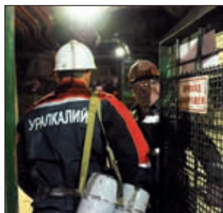
Потребители хотят иметь свою долю в «Уралкалии»

Новыми акционерами крупнейшего производителя калия в мире — «Уралкалия» — могут стать китайский суверенный фонд Chengdong Investment Corporation и «ВТБ капитал». Структуры акционеров «Уралкалия» выпустили в пользу фонда и инвестбанка облигации, которые могут быть конвертированы в 14,5 % акций компании.