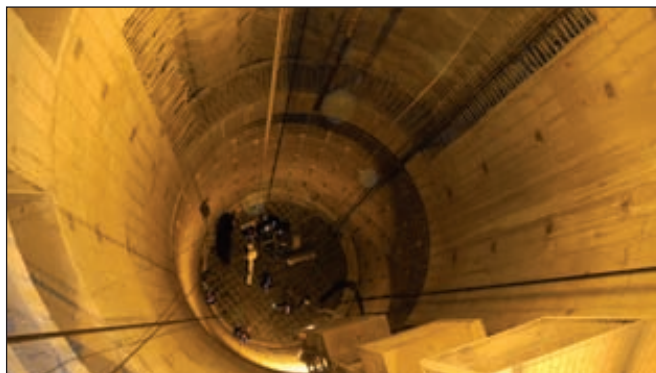
Клетовой ствол КС-2 Усольского калийного комбината на Верхнекамском месторождении

Проходка скипового и клетового шахтных стволов — наиболее трудоемкий и сложный этап строительства калийного ГОК. Скиповой ствол предназначен для подъема добываемой калийной руды из рудника, аварийного вывода людей и подачи свежего воздуха в подземные выработки. Клетовой ствол служит в первую очередь для спуска-подъема людей, оборудования и материалов на горизонт руд-