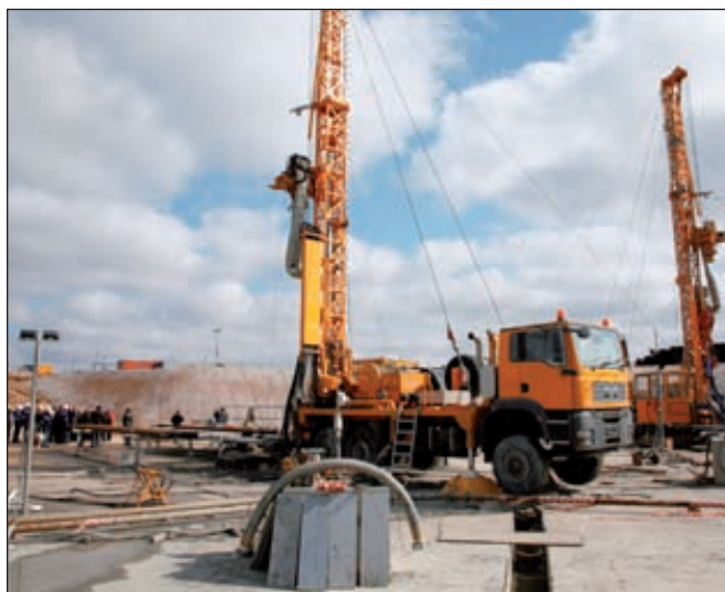
Строительство шахты на Гремячинском месторождении

В своей отчетности за девять месяцев 2012 года «Еврохим» списал в убыток 3,6 млрд рублей, из которых 495 млн рублей приходится на аванс в пользу Shaft Sinkers, а 3,116 млрд рублей — затраты, понесенные ранее на строительство шахты на Гремячинском месторождении. ■