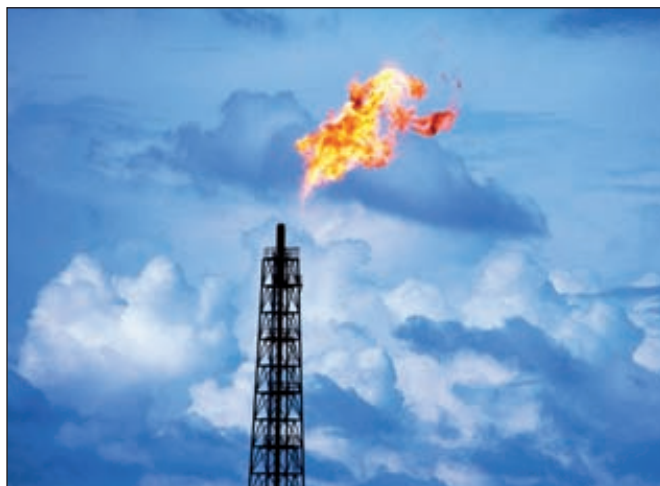
Повышение уровня утилизации ПНГ — важная часть программы ТНК-ВР по минимизации воздействия на окружающую среду

ТНК-ВР сообщила о расширении программы полезного использования попутного нефтяного газа (ПНГ): к 2015 году общий объем инвестиций в эти проекты вырастет на 12,7% — до 62 млрд рублей. Наибольшая часть вложений приходится на 2012 год — около 17 млрд рублей, что на четверть превышает показатель 2011 года.