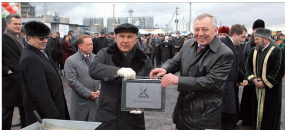
Президент Татарстана заложил в фундамент нового завода две капсулы с посланием потомкам

В основе проделанной работы по созданию проекта комплекса лежит совместный труд с партнерами из Франции, Германии, Японии, Южной Кореи и США. В составе комплекса будут построены установки гидроконверсии гудрона по производству водорода и серы, согласно технологии Veba Combi Cracking. Общая стоимость строительства комплекса — 1 млрд 835 млн долларов. Финансирование строительства будет осуществляться за счет средств ОАО «Таиф», а также кредитов. Срок ввода комплекса в эксплуатацию — 1 квартал 2016 года. ■