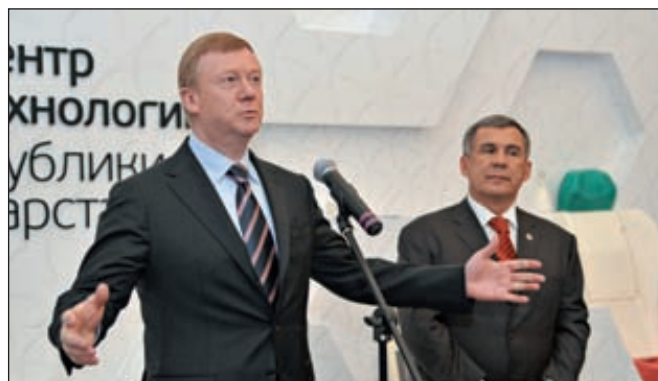
Анатолий Чубайс, председатель правления «Роснано», и Рустам Минниханов, президент Республики Татарстан, на открытии наноцентра

технологической цепочки производства. В результате затраты на коммерциализацию новых разработок снижаются в десятки раз, поскольку компаниям нет необходимости создавать собственный лабораторный комплекс на стадии разработки. Стоимость самого наноцентра составила 3,8 млрд рублей, в том числе софинансирование со стороны ОАО «Роснано» — 1,8 млрд рублей. ■