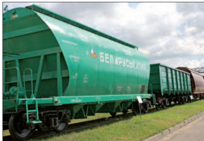
Указом Александра Лукашенко в Беларуси введена экспортная пошлина на поставку калийных удобрений

Чуть ранее правительство Беларуси, согласно постановлению N1046, установило на 2013 год для ОАО «Беларуськалий» лимит по добыче калийной соли в размере 7,4 млн т (в пересчете на оксид калия), что соответствует уровню 2012 года. Лимит на добычу каменной соли установлен в размере 2 млн т, что также соответствует уровню 2012 года. Для ОАО «Мозырьсоль» лимит на добычу этого вида сырья увеличен до 435 тыс. т против 425 тыс. т в 2012 году.