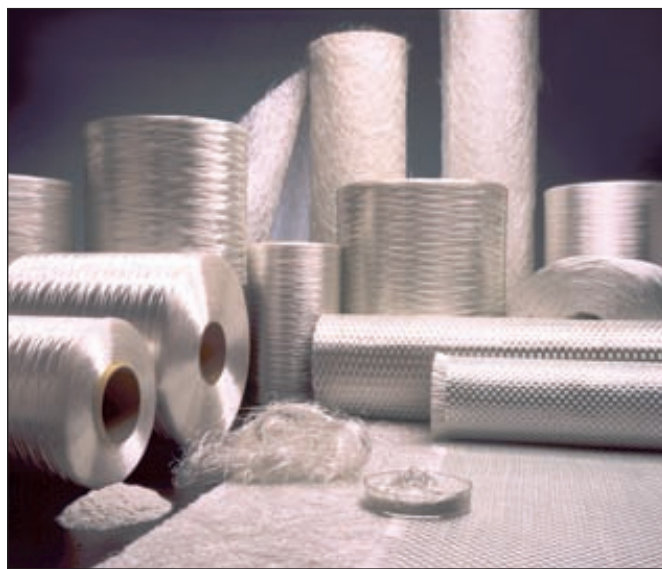
Стекловолокно для композиционных и строительных материалов

Компанией Owens Corning официально объявлено о запуске новой стекловатной печи в г. Гусь-Хрустальном. Мощности завода увеличены почти в 2 раза. Предприятие будет производить коррозионно-стойкое стекло Advantex® для российского рынка, а также ровинги и мокрые рубленые чопсы (WUCS) и другие виды продукции.