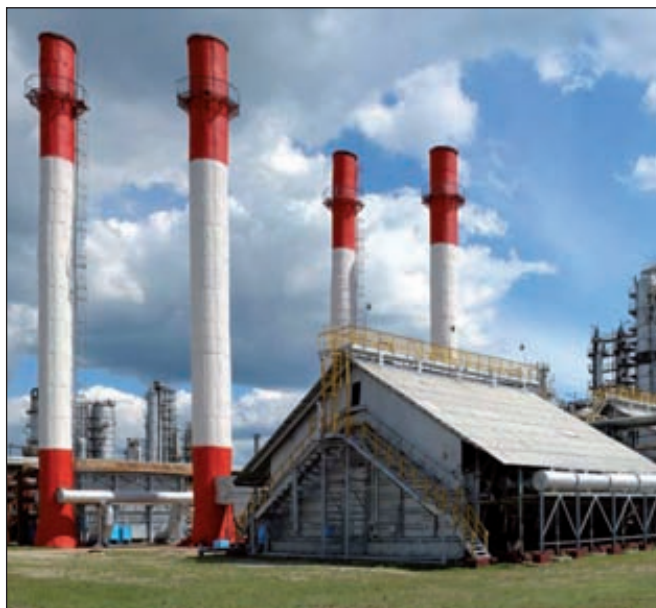
Производство «Нафтан», Новополоцк (Белоруссия)

Потенциальный владелец предприятия должен подписать согласованную инвестиционную программу. Семашко подчеркнул, что в настоящее время нет необходимости спешно продавать Новополоцкий завод: к 2015 году и Новополоцкий, и Мозырский НПЗ выйдут на уровень глубины переработки нефти 92–93 %.