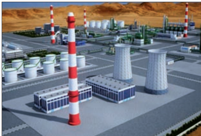
Проект химико-промышленного парка SOCAR

Расширение территории парка нужно для создания дополнительных производств химпродукции, в том числе полимеров, жидких химических, потребляемых, как на территории Азербайджана, так и востребованных на соседних и зарубежных рынках. В настоящее время завершаются работы по очистке и демонтажу имеющихся на территории конструкций. Уже начинаются работы по созданию социальных объектов и инфраструктуры, в том числе дорог, коммуникаций, а также идет проектирование новых предприятий. По мнению представителя SOCAR, открытие новых предприятий на территории парка возможно уже в 2013 году, к 2015 году могут быть завершены работы по вводу в эксплуатацию предприятий на его территории.