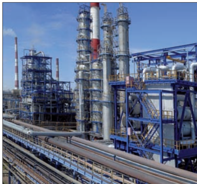
Производство «Таиф-НК», г. Нижнекамск (Республика Татарстан)

На нефтехимических предприятиях группы выпущено 1,5 млн т мономеров, 1 млн 59 тыс. т полимеров и 435 тыс. т каучуков. Наблюдается прирост по производству изопренового, галобутилового и дивинильного каучуков на литиевом катализаторе. Производства полистирола, полипропилена, сэвилена, поликарбоната работали с превышением проектной мощности.