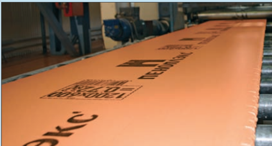
Производство ООО «ПЕНОПЛЭКС СПб»