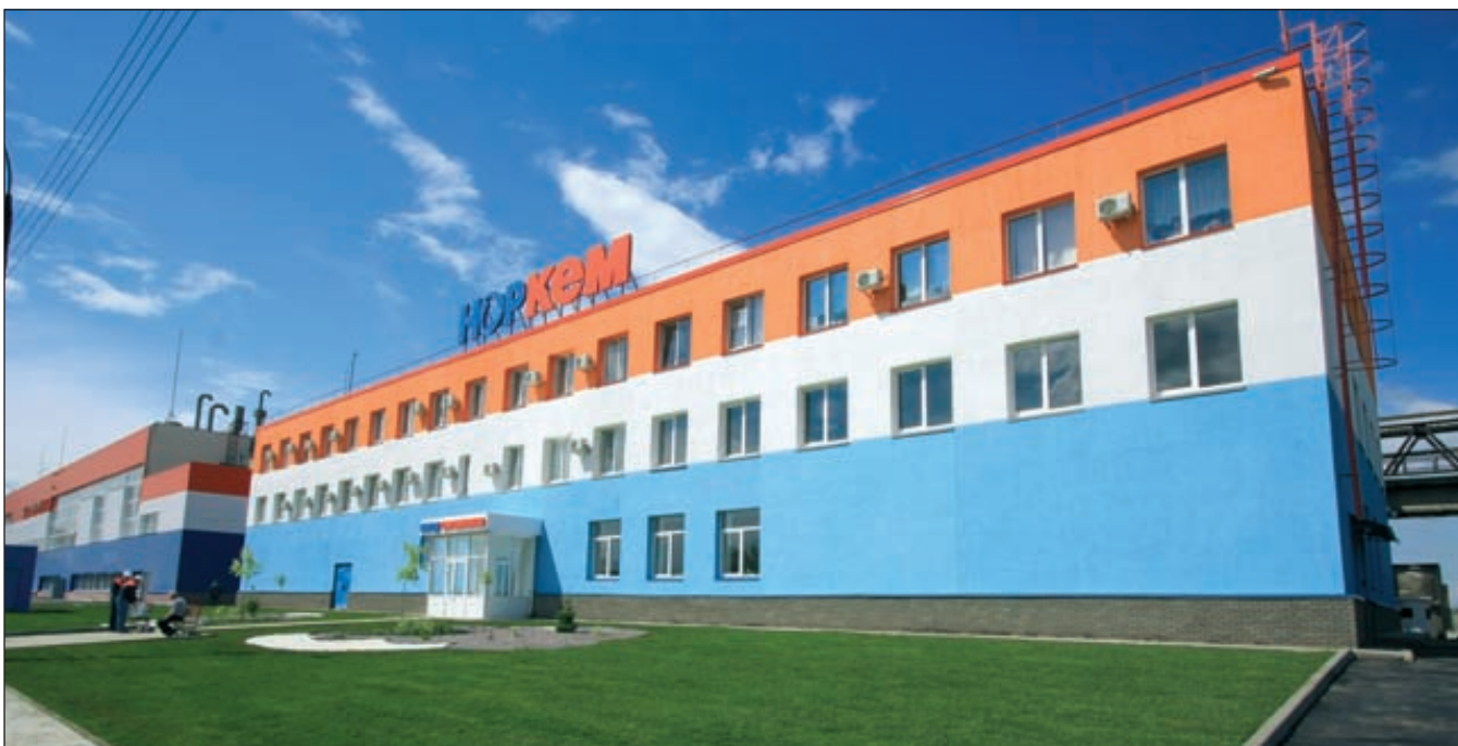
ООО «Завод синтанолов» / НОРКЕМ™ (г. Нижний Новгород)

венной лицевой поверхности изделий из формованного бетона. Кроме того, только они дают возможность получать самоуплотняющиеся бетоны класса Self Compacting Concretes (SCC) при кардинально сниженном водоцементном соотношении и современные бетоны с высокими эксплуатационными характеристиками класса High Performance Concretes (HPC).