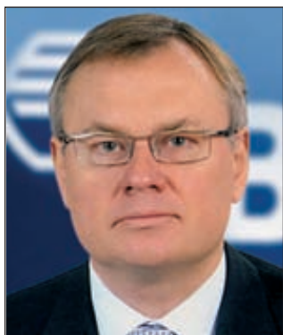
Андрей Костин, президент ОАО «Банк ВТБ»

Из совета директоров «Роснефти» выйдет президент ОАО «Банк ВТБ» Андрей Костин, который работал там с 2006 года. Причиной отставки Костина, возможно, стало то, что на заседаниях комитета по кадрам и вознаграждениям совета директоров он отклонял новую структуру управления компании, так как считал ее чрезмерно раздутой. Заменит