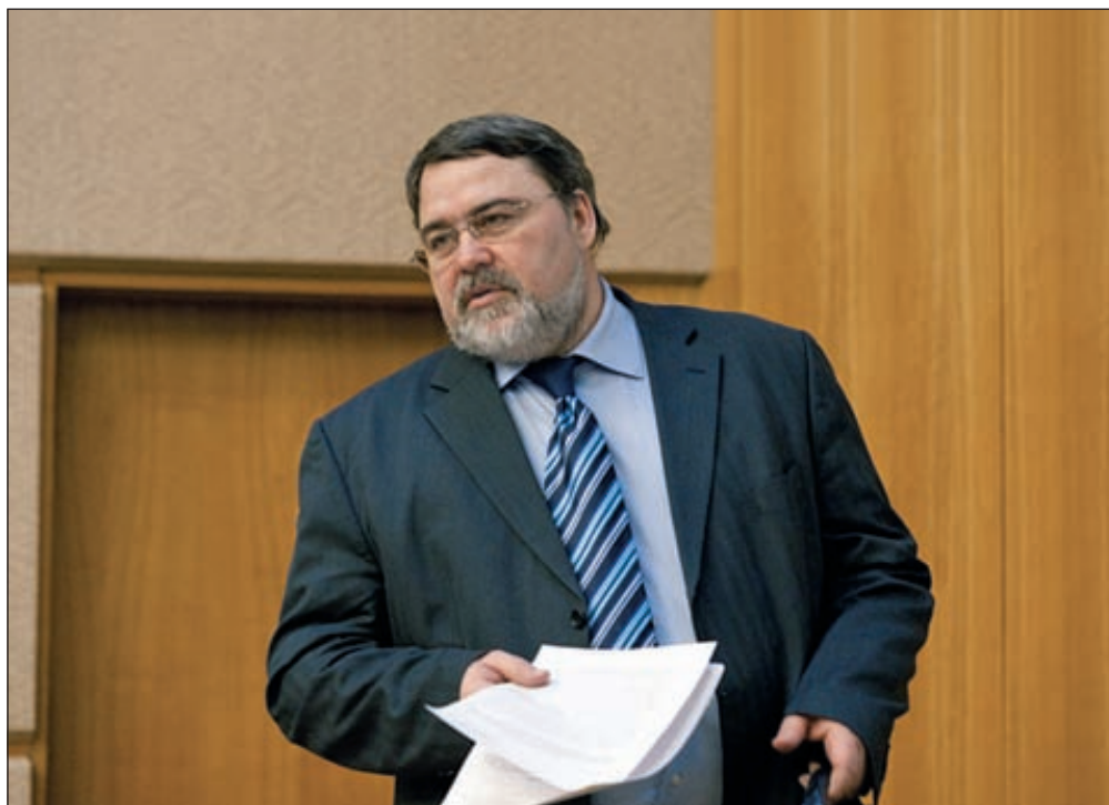
Игорь Артемьев, руководитель ФАС. Антимонопольная служба за заключение картельных соглашений на рынке каустической соды наложит административный штраф

В компаниях, обвиняемых в сговоре на рынке каустика, от комментариев отказываются до тщательного изучения текста решения. ■