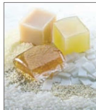
В 2012 году «Оргхим» планирует выпустить 110 тыс. т масел для каучуков в год

Биохимический холдинг «Оргхим» создан в 2001 году, занимается разработкой и производством смол и эмульгаторов для синтетического каучука, добычей сосновой живицы и производством канифоли. ■