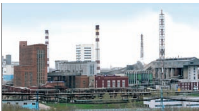
Производство ОАО «Сода» (Башкортостан). «Башкирская химия» намерена объединить «Соду», «Каустик» и Березниковский содовый завод

«Башкирская химия» намерена объединить «Соду», «Каустик» и Березниковский содовый завод. Эксперты рынка считают, что подобное объединение может быть связано с предпродажной подготовкой или желанием акционеров провести IPO. Стоимость холдинга может составить до полумиллиарда долларов.