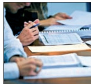
«Метафракс» в 2012 году планирует вложить в развитие производства 820 млн рублей

на 16%, до 8,059 млрд рублей. Производство метанола в январе-ноябре снизилось на 5 % — до 879 тыс. т в связи с остановкой оборудования на плановый ремонт в августе. Производство формалина возросло на 25 % — до 284 тыс. т, карбамидоформальдегидного концентрата (КФК) — на 14 %, до 180 тыс. т, пентаэритрита — на 20 %, до 20 тыс. т, уротропина — в 1,5 раза до 20 тыс. т. ■