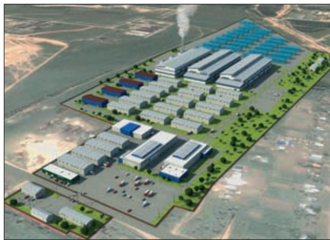
Проект индустриального парка «М-7»

Н а территории Татарстана существуют 14 технопарков и 5 бизнес-инкубаторов.