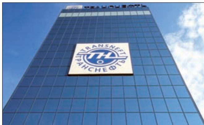
Правительство продаст 3 % акций «Транснефти»