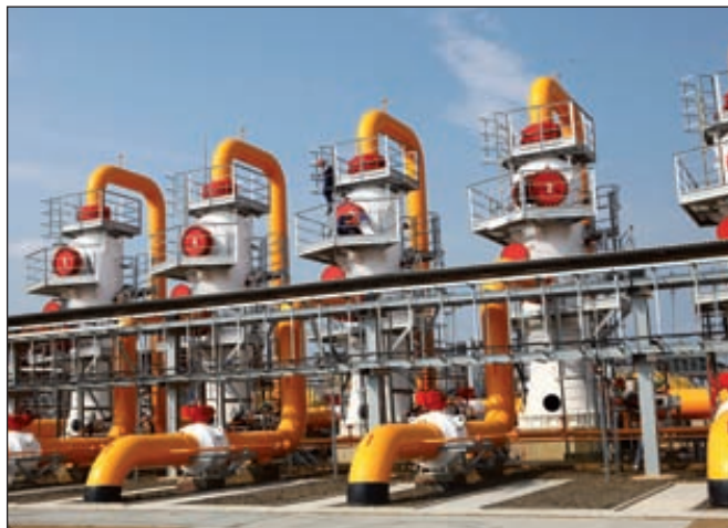
Россия скупает энергетические активы Европы

Уже в мае стало известно, что «Роснефть» может купить 7,29 % акций итальянской нефтеперерабатывающей группы Saras по цене 1,370 евро за акцию. Компания объявила о начале добровольного частичного публичного тендерного предложения в отношении обыкновенных акций Saras S.p.A. Предложение касается 69 310 933 обыкновенных акций, со-