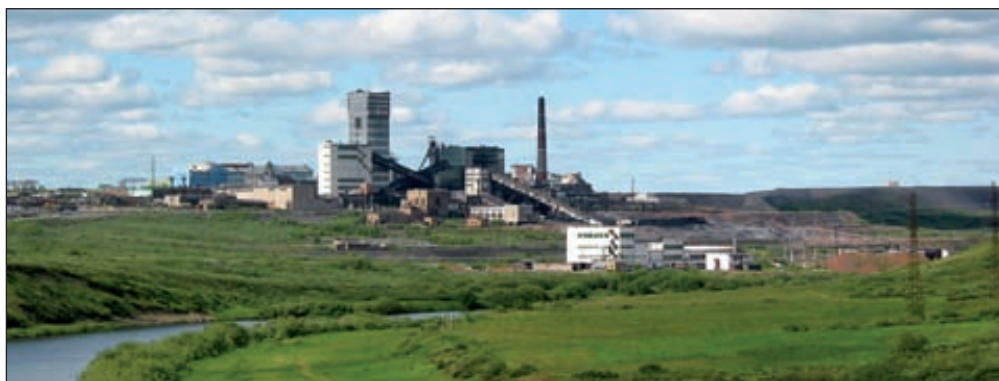
«Беларуськалий» начнет экспорт NPK-удобрений в июне этого года

В строительство и запуск первой очереди химкомбината будет инвестировано около 100 млн долларов. Первая очередь нового химкомбината должна быть открыта не позднее 31 декабря. Помимо едкого калия и соляной кислоты, здесь будут производить гипохлорит натрия. Плановая мощность первой очереди химкомбината предусматривает получение в год 10 тыс. т 100-процентного гидроксида калия (едкий калий), 17,5 тыс. т 35-процентного раствора соляной кислоты и 4,2 тыс. т гипохлорита натрия. Проектом предусмот-