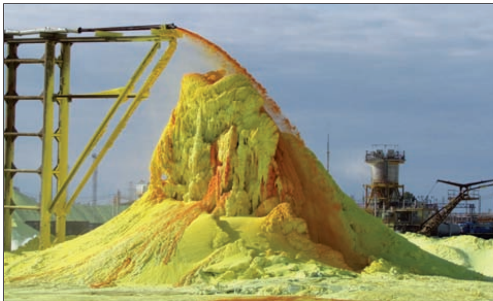
Суд подтвердил выводы ФАС о нарушениях «Газпрома» на рынке жидкой серы

«Газпром» не согласился с решением ФАС и подал иск в суд. Как заявил на заседании представитель «Газпрома», ФАС недостаточно исследовала рынок жидкой серы и не учла объем реализации комовой и гранулиро-