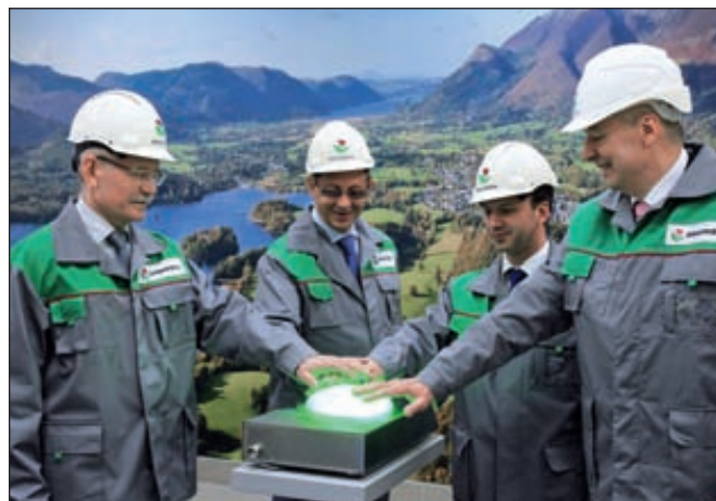
■ Запуск производства сернокислотного алкилирования, Уфа

Установка регенерации отработанной серной кислоты обеспечит непрерывную регенерацию кислоты по технологии компании «Хальдор Топсе» (Дания). Серная кислота выступает в качестве катализатора реакции алкилирования. В результате одновременно со снижением экологических рисков будет обеспечена устойчивая работа установки сернокислотного алкилирования. Генподрядчик проекта — ОАО «Нефтехимремонт».