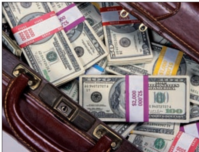
«Фосагро» собирается объединить все дочерние предприятия, занятые в производстве