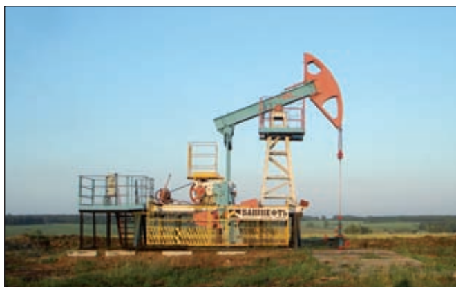
«Башнефть» увеличила в 1-м квартале добычу нефти на 0,1 %, переработку — на 1,9 %

«Башнефть» увеличила в январе–марте 2013 года добычу нефти по сравнению с 1 кварталом предшествующего года на 0,1 %, до 3,844 млн т. Среднесуточная добыча составила в отчетном периоде 42,7 тыс. т, достигнув максимального уровня за 17 лет.