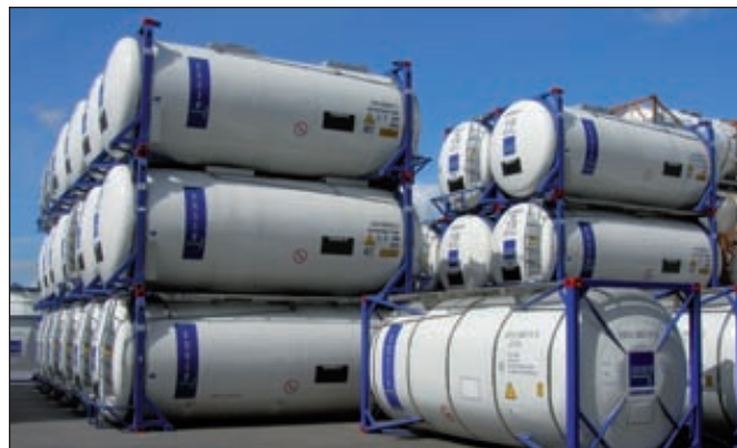
Химическое производство в России вырастет к 2020 году по сравнению с 2011 годом на 54,3 %

Консервативный сценарий развития отрасли предполагает