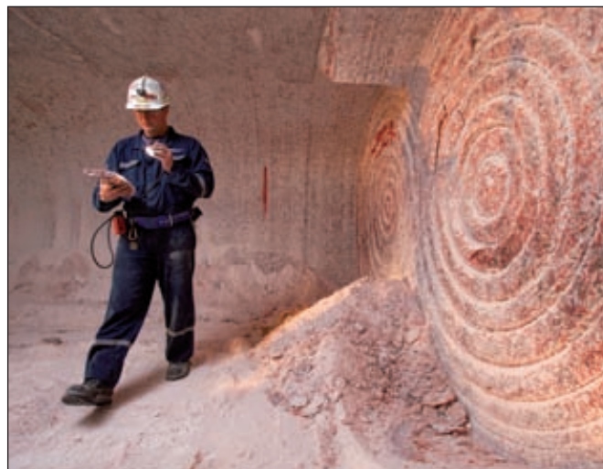
По результатам исследований ресурсы проекта Foam Lake (Канада) составляют 942 млн т калийных солей

Администрация губернатора Пермского края сообщила, что новая установка будет построена на Губахинской площадке предприятия. Мощность установки составит 400–600 тыс. т продукции, при этом более трети продукта пойдет на внутреннюю переработку. Собственное производство карбамида должно суше-