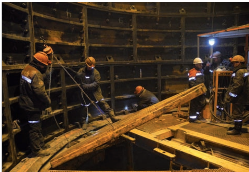
Усольский калийный комбинат, клетевой ствол

Напомним, в 2008 году компания «Еврохим» выиграла аукцион на право пользования Палашерского и Балахонцевского участков Верхнекамского калийного месторождения. К непосредственному строительству Усольского калийного комбината компания приступила в начале прошлого года. Работы идут по графику. К концу следующего года завершится проходка скипового и клетьевого стволов. На полную мощность комбинат заработает к 2018 году, когда будет достигнута производительность 2,4 млн т хлористого калия в год, а к 2021 году производительность составит 3,5 млн т в год. Общий объем инвестиций в проект — около 75 млрд рублей.