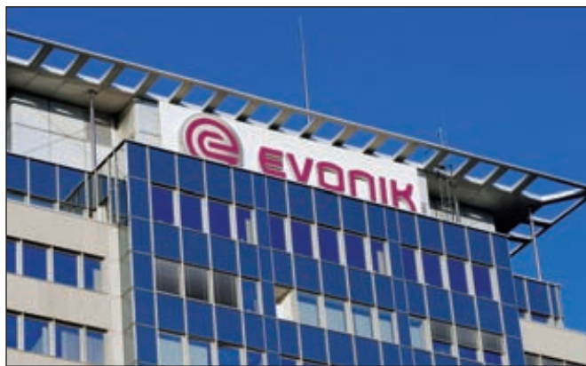
Evonik ищет площадку для производства аминокислот

Концерн Evonik и администрация Ростовской области подписали соглашение о сотрудничестве. Речь идет о строительстве завода по производству кормовой добавки Biolys® совместным пред-