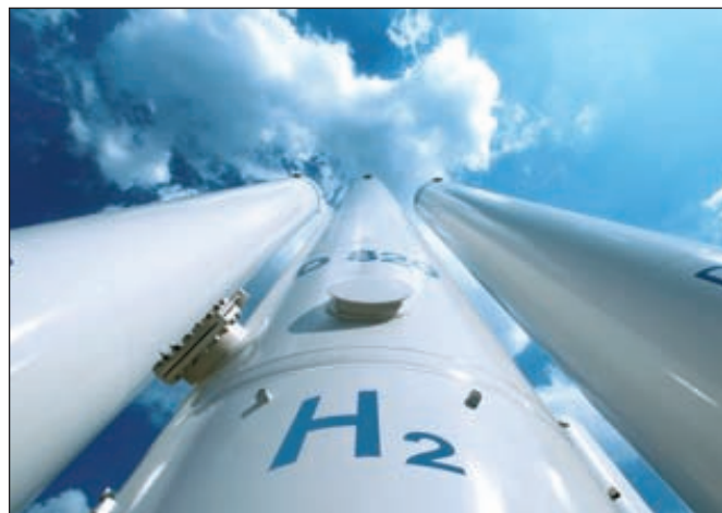
Стоимость 50% доли «КуйбышевАзота» в СП с Linde составит 31,5 млн евро

Ранее «КуйбышевАзот» планировал участие в СП с долей 24% номинальной стоимостью не более 15 млн евро. Соответствующее решение совета директоров было принято в ноябре 2012 года. ■