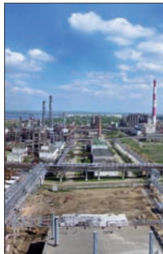
Предприятие «Ставролен», Ставропольский край

итогам 11 месяцев на 9,5%, а производство полимеров пропилена — на 6,7%.