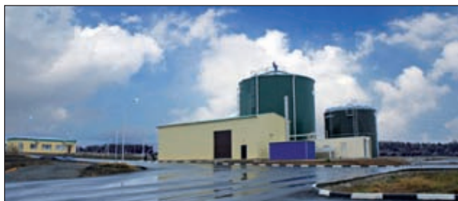
Биогазовая установка «Байцуры»

Запуск биогазовых установок в Белгородской области позволяет не только получать альтернативный источник энергии и органические удобрения, но и утилизировать отходы животноводства, сохраняя тем самым окружающую среду.