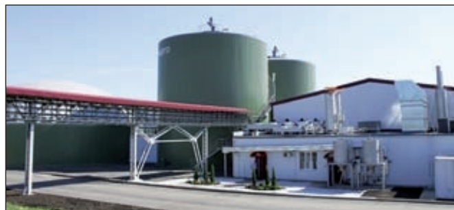
Биогазовая установка «Лучки»