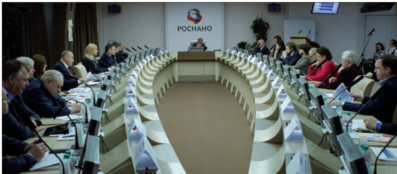
Семинар по программе «БИО-2020» в «Роснано»

В «Роснано» прошел семинар, на котором представители академической и прикладной науки, бизнеса, институтов развития и власти обсудили перспективы российской биотехнологической отрасли.