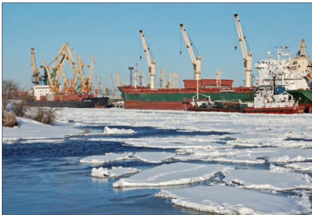
ФСТ опубликовала проекты приказов об отмене тарифного регулирования услуги по погрузке и выгрузке, хранению грузов стивидорных компаний

Несмотря на предложение Минтранса, портовые операторы не будут исключены из списка субъектов естественных монополий — на этом настояла ФАС. Компании, как и раньше, будут согласовывать с антимонопольным