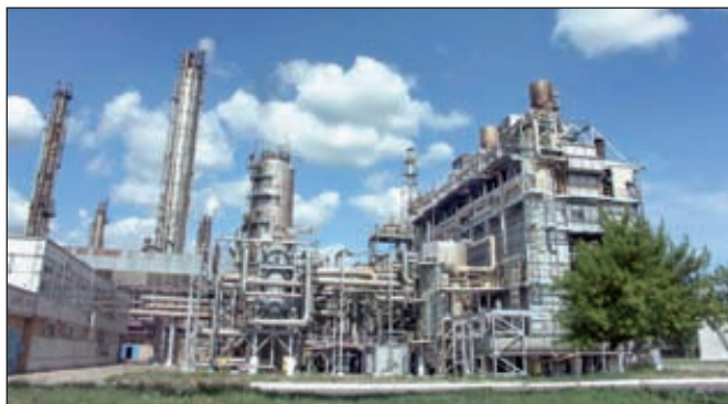
Производство ОАО «Тольяттиазот»

Компания «Уралхим» намерена добиваться возбуждения уголовных дел по каждому эпизоду вывода активов «Тольяттиазота» по мере формирования пакетов документов, необходимых для подачи заявлений в правоохранительные органы. ■