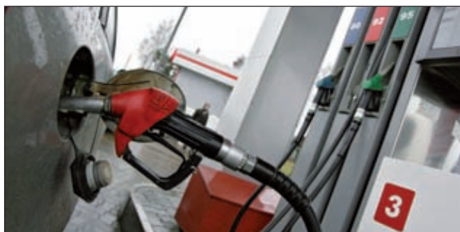
Казахстан решил временно отказаться от российского бензина

Казахстан рассматривает возможность введения временного запрета на импорт российских нефтепродуктов. Министерство нефти и газа этой страны уже подготовило два проекта постановления правительства. В СМИ появились копии документов.