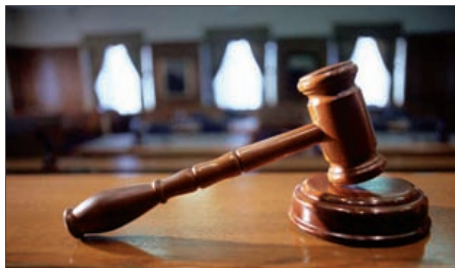
КуАз пытается вернуть 1,68 млрд рублей, которые компания не получила «по неосмотрительности Сбербанка РФ»