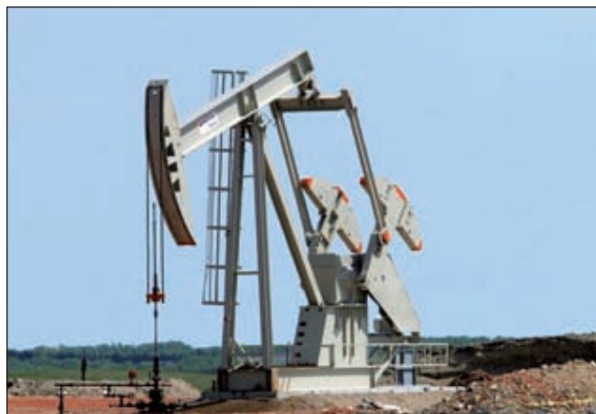
США выйдут в лидеры по добыче нефти уже в текущем десятилетии

Если ОПЕК будет готов поставлять на рынок меньше, чтобы поддержать котировки, цена нефти может упасть до 100 долларов за баррель (в ре-