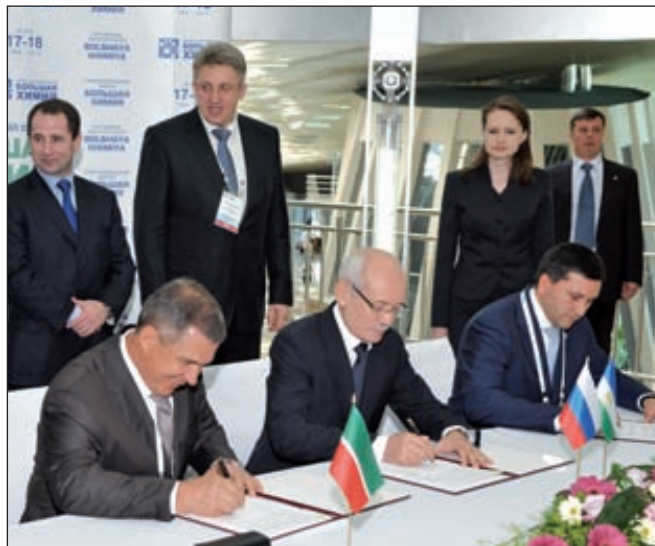
Подписание соглашения между Башкортостаном, Татарстаном и Ямало-Ненецким автономным округом на II Международном форуме «Большая химия», май 2012 года

Не исключено, что к соглашению присоединится Хан-