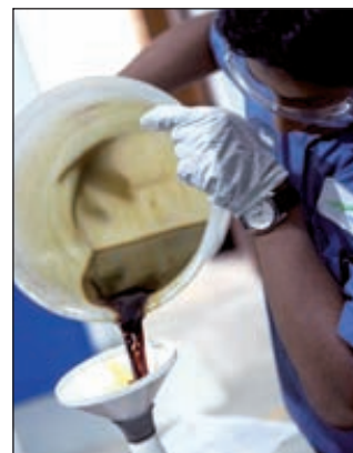
В химпарке «Тагил» будут делать биотопливо

Renmatix является разработчиком технологии Plantrose, обеспечивающей переработку и расщепление древесины в сахар без использования кислот или энзимов. ■