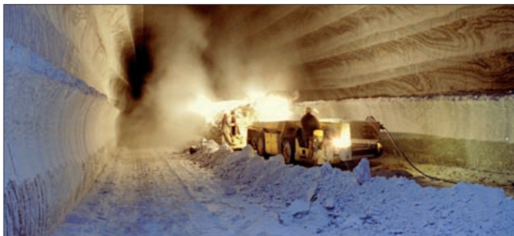
«Уралкалий» заключил долгосрочные контракты

Соглашения заключены в соответствии с рекомендациями Федеральной антимонопольной службы (ФАС) России по обеспечению не дискриминационного доступа к приобретению хлористого