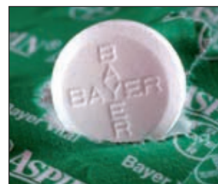
Аспирин изначально был торговой маркой Bayer и принес компании широкую известность

В целом в 2012 году продажи Bayer составили 39,7 млрд евро по всему миру. ■