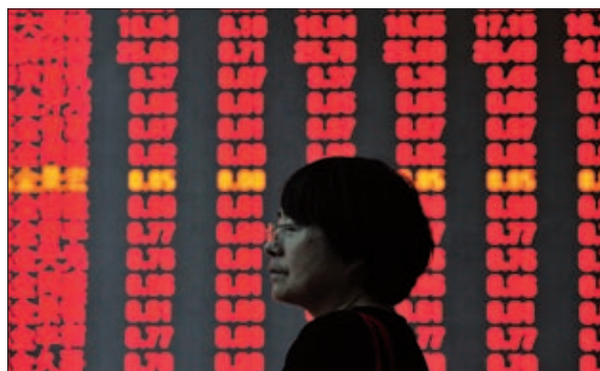
■ Чистая прибыль Sinopec выросла на 24%

Стоит отметить, что остальные китайские гиганты нефтепереработки также отметили увеличение прибыли. Так, прибыль PetroChina выросла на 5,6% за первые шесть месяцев этого года, по сравнению с тем же периодом годом ранее. Доходы Sinopec за этот же период выросли на 7,9% по сравнению с 2012 годом.