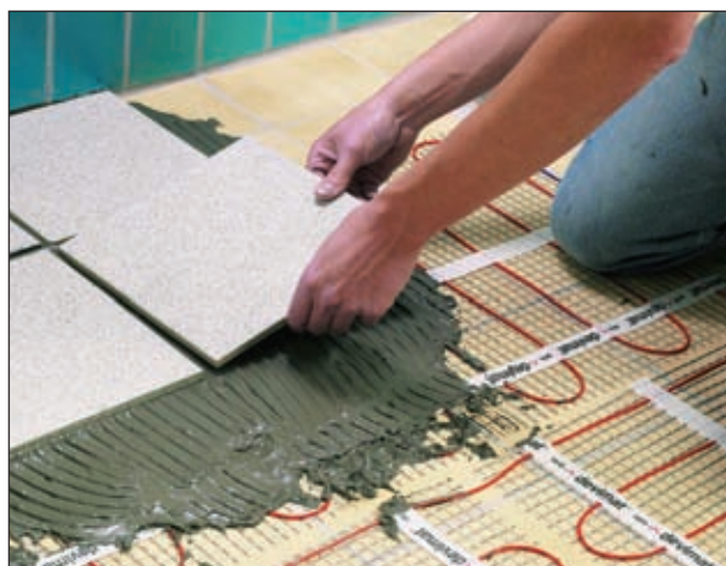
■ Сегмент архитектурно-строительных материалов постепенно теряет ценность для компании AkzoNobel, превращаясь в непрофильный актив

Напомним, что AkzoNobel уже продала североамериканское подразделение декоративных красок PPG Industries и сеть розничных магазинов в Германии, насчитывающую 72 торговых точки. Теперь компания планирует перевести свое производство из Голландии. ■