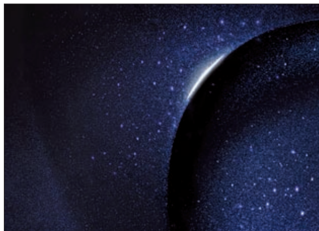
Новые покрытия XSpark от BASF создают эксклюзивный эффект со сверкающим блеском