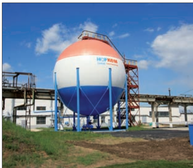
ООО «Завод синтанолов» является ведущим российским производителем поверхностно-активных веществ (ПАВ) и полиэтиленгликолей (ПЭГ) под торговой маркой «Норкем»

и их смесевые рецептуры, но и поставлять их к местам использования. Меморандум о сотрудничестве между SNS SAS и ГК «Норкем» был подписан в июне 2013 года. Стороны договорились совместно изучать, развивать и поставлять российским нефтяным компаниям химические компоненты для повышения нефтеотдачи пластов — ИОН (EOR), в том числе для полимерного заводнения с использованием поверхностно-активных веществ ПАВ — (технологии SP & ASP). Реализация проекта, по мнению его участников, серьезно