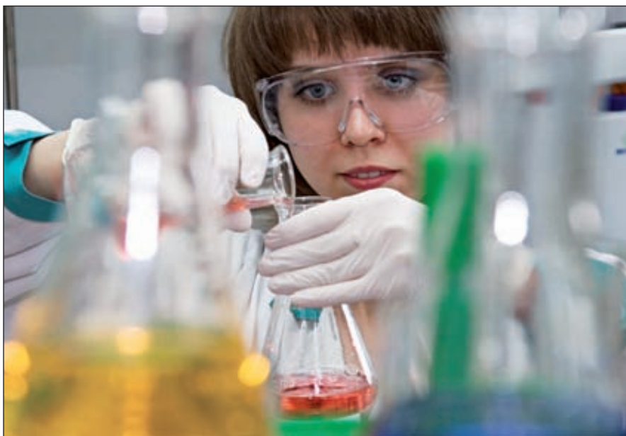
Синтетические водорастворимые полимеры широко используются для повышения нефтеотдачи

Метод химического повышения отдачи, который предполагает введение водорастворимых полимеров в виде растворов, — это эффективная технология с подтвержденными результатами. Для увеличения вязкости в подземные слои вводится полимерный раствор, обеспечивая таким образом эффективность вытеснения в скважине и контроль подвижности между водой и углеводородами. Возможно введение вязкого раствора как отдельно, так и в комбинации с ПАВ и в комбинации с другими химическими соединениями, которые увеличивают отдачу нефти. Среди таких химических соединений можно выделить слабые, силь-