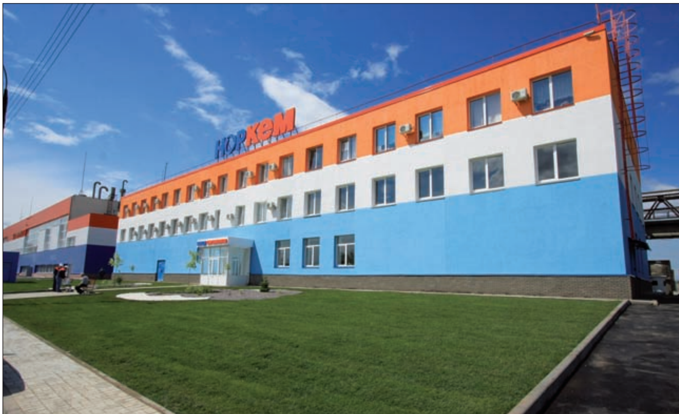
ООО «Завод синтанолов» /«Норкем» (г. Нижний Новгород)

«Норкем» планирует в ближайшем будущем стать поставщиком ПАВ для проектов повышения эффективности нефтеотдачи скважин