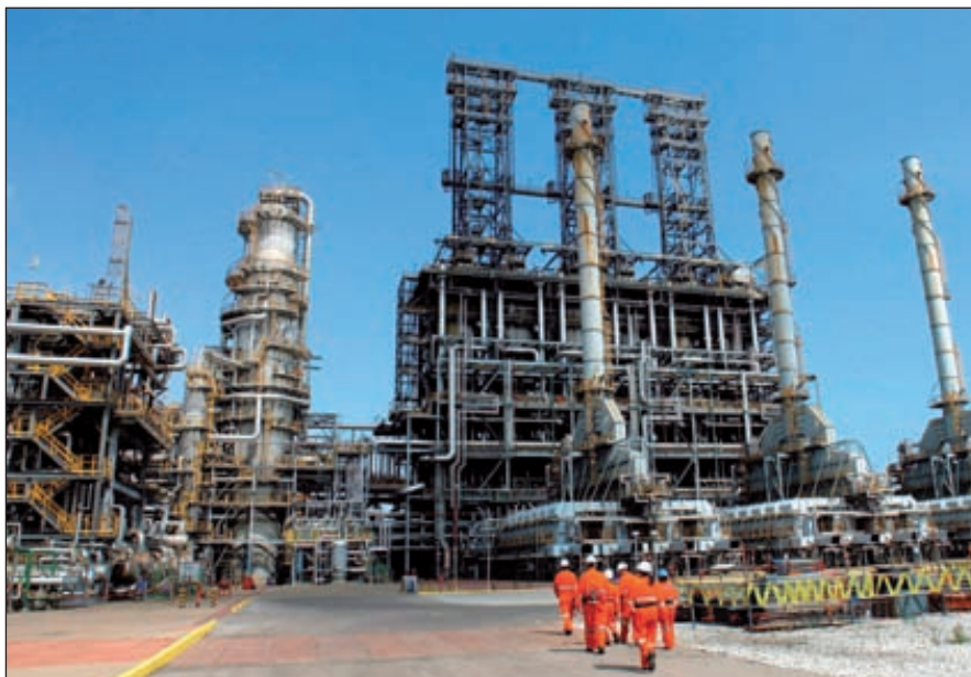
Химическая промышленность оживает и остро нуждается в молодых специалистах

Давно сложились предпосылки для пересмотра методологических подходов, сущностная и технологическая отсталость тяготит и сдерживает развитие химпрома. Некомпетентность, административные