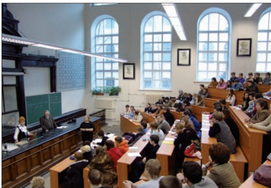
Большая химическая аудитория СПбГТИ (ТУ)

Целенаправленная государственная политика в области образования в XIX–XX веках, особенно в сфере подготовки технических кадров высшего и среднего звена, позволила достичь удивительных результатов: уже в 1904–1914 годах Россия, обойдя Германию, наряду с США стала мировым лидером в области технического образования. В отличие от Европы, развитие инженерного искусства в России было связано в первую очередь с военно-политическими задачами, а не с естественным ходом развития торговли, науки, промышленности и экономики страны. На протяжении более двух веков военные инженеры и инженеры военно-промышленных специальностей занимали ключевые позиции на различных гражданских объектах, комплексах и производствах. Обучение отечественных инженерных кадров для растущей гражданской промышленности велось в XIX веке офицерами, инженерами и учеными военных академий и специальных полувоенных корпусов.