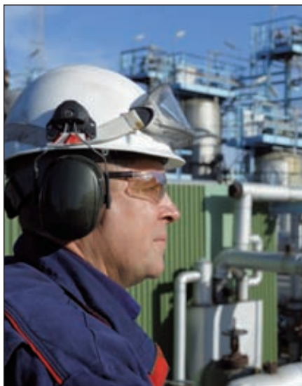
Человеческий капитал — ресурс будущего

Формирование инновационных центров и технологических кластеров в рамках сложившейся географической локализации промышленных, научных, инжиниринговых организаций и учебных заведений, а также международное сотрудничество могли бы дополнять друг друга и способствовать развитию нового индустриального пути. Сегодня инновации — это основа развития технологии и производств XXI века, связующее звено от лабораторных и маркетинговых изысканий до новых процессов переработки и выпуска на рынок новых продуктов различных подотраслей химической промышленности. Возрождение российской инженерной школы с физико-технической моделью образования и учет последних мировых достижений — есть первейшая задача экономики РФ, только в этом случае у нее есть будущее. ■