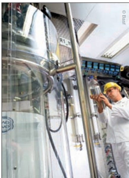
Кроме производства инновационных продуктов важно и умение продать инновации на рынке

факторов пожаро- и взрывоопасности, экологической безопасности, наличия вредных производственных факторов, минимизации отходов и производственных потерь, особенностей управления (регулирования) и автоматизации.