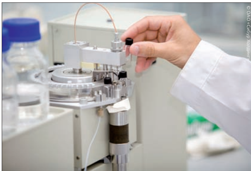
Новые химические технологии отличаются сложностью реализации и предъявляют сверхжесткие требования к уровню подготовки и дисциплины рабочего персонала

Важен аспект масштабирования и корректности переноса модели разработки или технологического процесса на функционирующее пилотное или тоннажное производство. Использование междисциплинарного опыта и знаний применительно к технологическим, техническим и управленческим задачам позволяет выявлять и ликвидировать «узкие» места производственной деятельности, наладить выпуск реально высококачественной продукции, что является, в большинстве случаев, исключительной компетенцией организации и ее сотрудников и, что дает ей, в конечном итоге, значительные конкурентные преимущества.