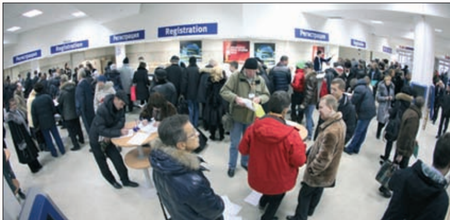
Более 20 тыс. специалистов посетили московскую выставку «Интерпластика — 2012» в этом году