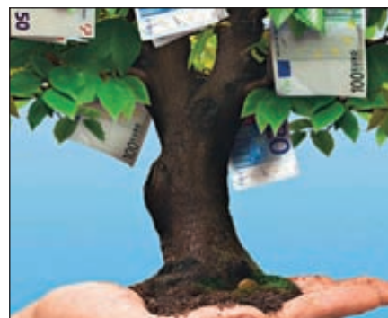
Объем инвестиций в основной капитал МП за три квартала 2010 года в целом по РФ составил 163 079 млн рублей, что на 2,8% ниже показателя за аналогичный период прошлого года

По итогам января-сентября 2010 года в 34 регионах отмечена положительная