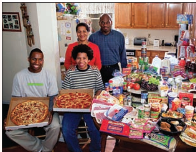
Производители упаковочных материалов являются основными потребителями полимеров. На фото семья из Северной Каролины и запас еды на неделю