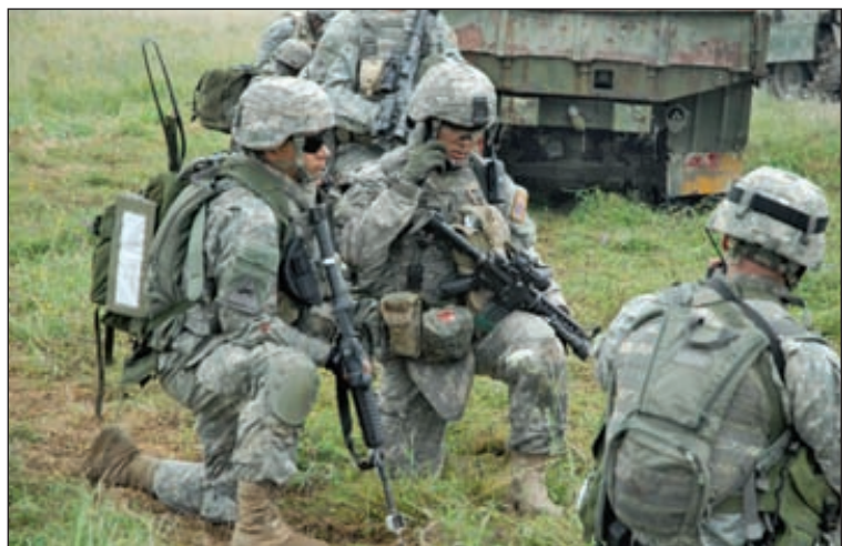
Кевлар — арамидное волокно для баллистической защиты. Было изобретено в 1965 году и запатентовано фирмой Дюпон (DuPont™ Kevlar®). Впервые было использовано в бронезиловках в США