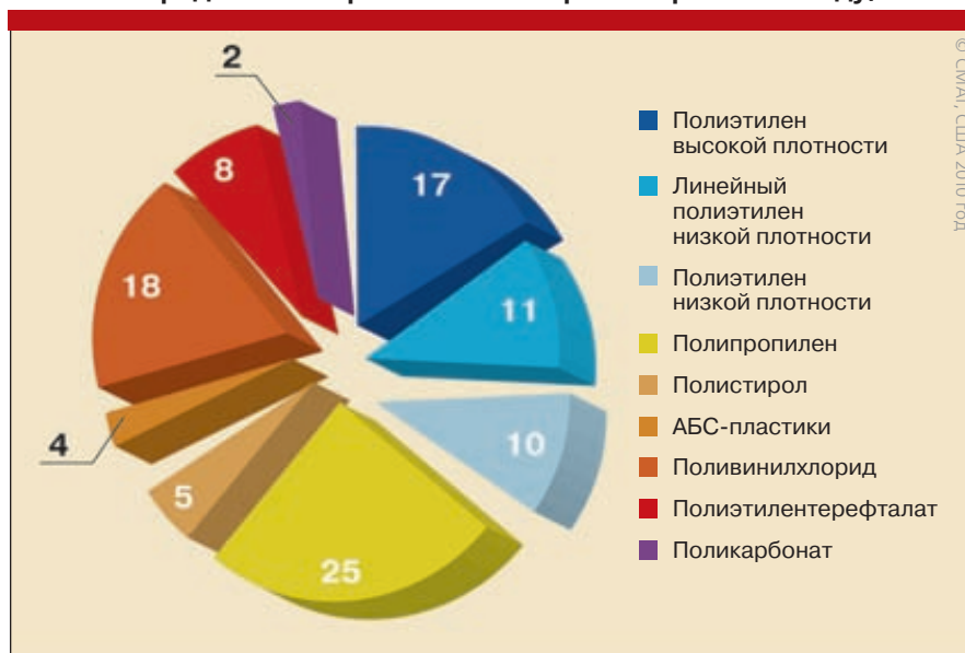
Рис. 1. Распределение спроса на полимеры в мире в 2009 году, %

де. Все это неблагоприятным образом сказалось на спросе пластиковых автокомплекующих со стороны автопроизводителей.