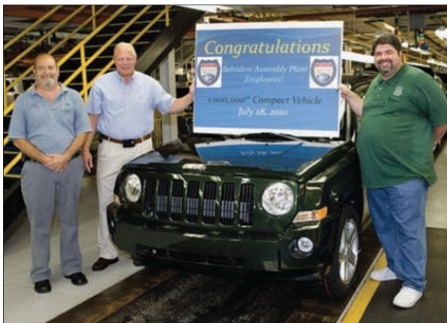
28 июля 2010 года с конвейера на заводе Belvidere Assembly (штат Иллинойс) сошел миллионный автомобиль Chrysler

рядка 80% внутреннего спроса на ПВХ приходится на строительный сектор — это производство труб, оконных рам, сайдинга, кабелей и т. п. Именно падение объемов производства в перечисленных сферах привело к снижению спроса на внутреннем рынке в прошедшем году.