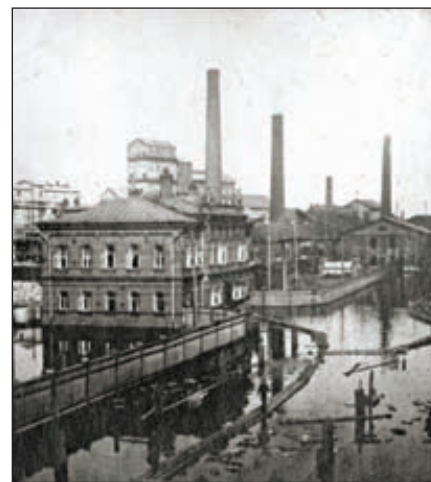
Заводоуправление БСЗ, 1914 г.

Новость шокировала бельгийцев, которые к этому моменту уже имели трех представителей в совете директоров БСЗ. Выяснилось, что Sodium Group решила не продлевать срок действия договора с Solvay о купле-продаже акций еще до того, как ФАС вынесла свой вердикт.