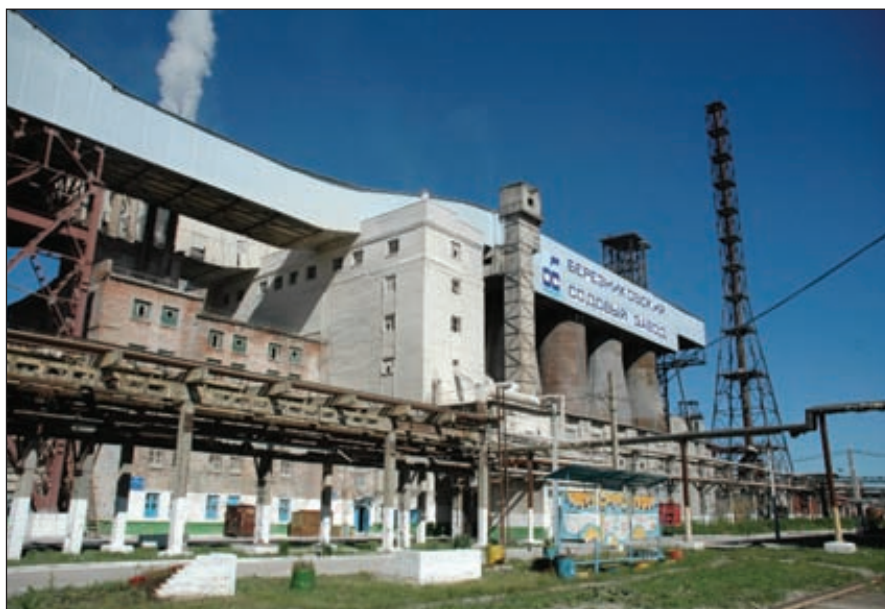
Березниковский содовый завод (Пермский край)

Однако антимонопольная служба России отказала «Сольвей Партигисипасьон Франс С.А.С.», также как и второму претенденту — ОАО «Сода» (входит в состав ОАО «Башкирская химия»), в доверительном управлении которого акции БСЗ находились с 2008 года, в ходатайстве о приобретении 97 % голосующих акций