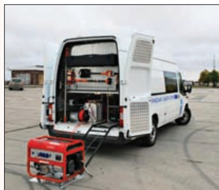
Мобильная экологическая лаборатория (МЭЛ-В) для контроля загрязнения воды и почвы, разработанная ЗАО «Экрос-Инжиниринг» для системы комплексного экологического мониторинга в зоне проведения XXII зимних олимпийских игр 2014 года в г. Сочи

новлена на небольших предприятиях ЖКХ, в удаленных населенных пунктах и решает традиционные задачи «малой» энергетики. Большая часть состоявшихся внедрений на Украине и в Белоруссии приходится на объекты коммунального хозяйства, учебные заведения, малые предприятия. В России спрос на установки формирует сектор ЖКХ. Цена получаемых энергии и пара существенно ниже рыночной цены, предлагаемой естественными монополиями. Компания перестает нести затраты на вывоз и захоронение отходов, при использовании мини-ТЭС компания может получать прибыль, утилизируя отходы ближайших потребителей. ЗАО «Биоэнергетик» запатентован и новый способ переработки мусора с утилизацией диоксинов и фуранов, увеличивающий общую стоимость переработки лишь на 20 %. По утверждению Михаила Зайкова, этот показатель выгодно отличает установку от крупных промышленных решений, поскольку при поставке дополнительно модуля очистки отходящих газов — стоимость мусоросжигательного завода увеличивается на 90–100 %. Расчетный срок