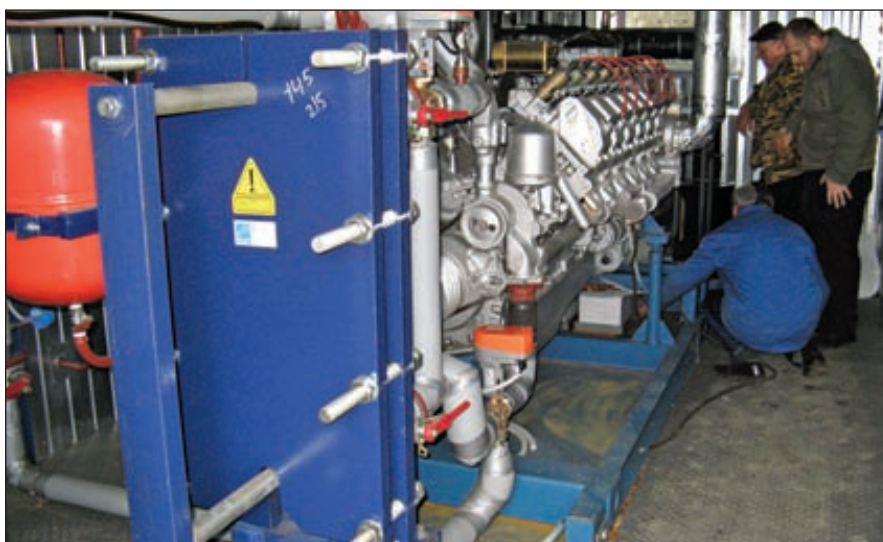
Электрогенератор установки мини-ТЭС ЗАО «Биоэнергетик» электрической мощностью 315 кВт/час. Установки для переработки ТБО и других отходов методом высокотемпературного пиролиза в течение 9 лет поставляются на рынки СНГ