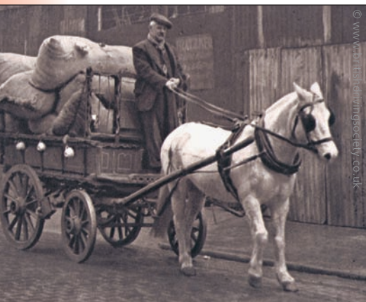
Сборщик вторсырья в Лондоне. Вместо денег в обмен за отходы предлагается посуда

В настоящее время муниципалитеты развитых стран приспособили схемы сбора мусорных контейнеров к решению смежной задачи — сокращению отправляемого на свалки мусора за счет раздельного сбора бытовых отходов и их повторной переработки. В качестве контейнеров обычно используются большие баки с крышками, мешки разного цвета и небольшие открытые пластиковые ведра. Из состава муниципальных бытовых отходов выделяют мусор, разлагаемый микроорганизмами, а также использованную пластмассу, годную для повторной переработки. Биоразлагаемые отходы включают так называемые «зеленые отходы» (трава, садовые и растительные пищевые отходы), пищевые отходы и бумагу. Повторно перерабатываемые материалы включают пластмассы (ПЭТФ, окрашенный и неокрашенный ПЭНД, емкости из ПВХ с узким горлышком, ПЭВД, полипропилен, смешанные пластмассы); стекло; металлы (железо и цветные); смешанные материалы, разделяемые на чистых мусоросортировочных предприятиях. При использовании схемы curbside collection для раздельного сбора мусора велико значение сознательности и информированности граждан.