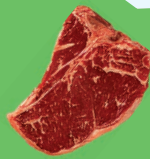
Мясо и кости