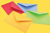
Конверты и почтовые рассылки