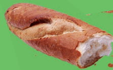
Хлеб, выпечка и мука