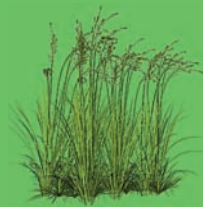
Скошенная с газонов трава