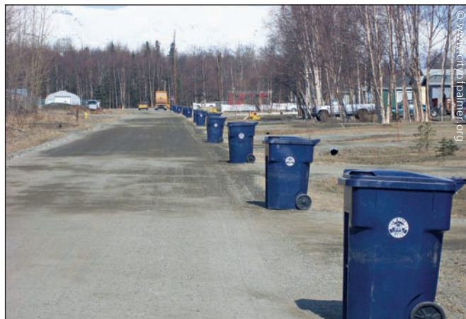
Мусорные контейнеры на Аляске

При подготовке статьи были использованы материалы из Википедии.