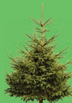
Ветви и побеги деревьев