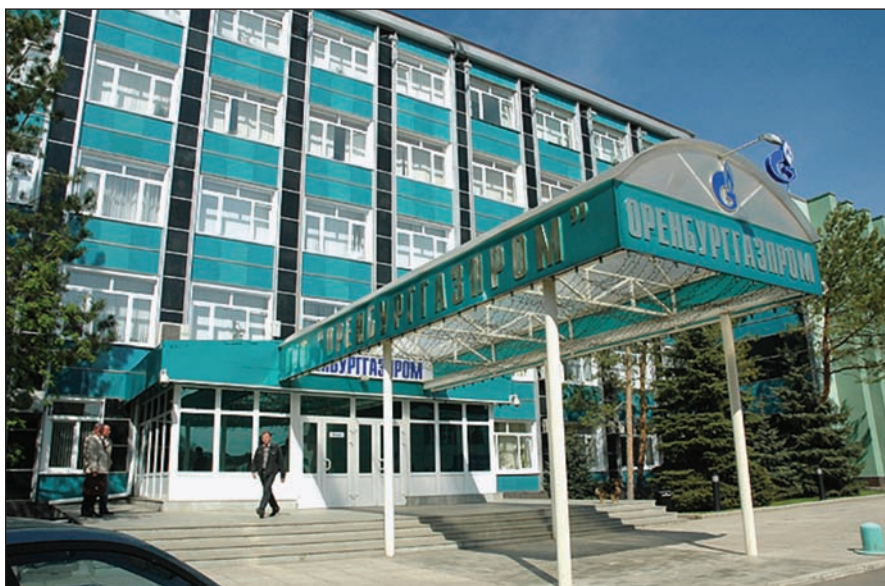
ФАС обязала ОАО «Газпром» расторгнуть невыгодный для ОАО «Казаньоргсинтез» договор на переработку этана в полиэтилен. «Оренбурггазпром», «дочка» Газпрома, является основным поставщиком этана

Поддержка рынка переработки, увеличение производства товаров внутри страны — важнейшая национальная задача. В этом секрет политической устойчивости государства, стабильности роста его торгового баланса. ■