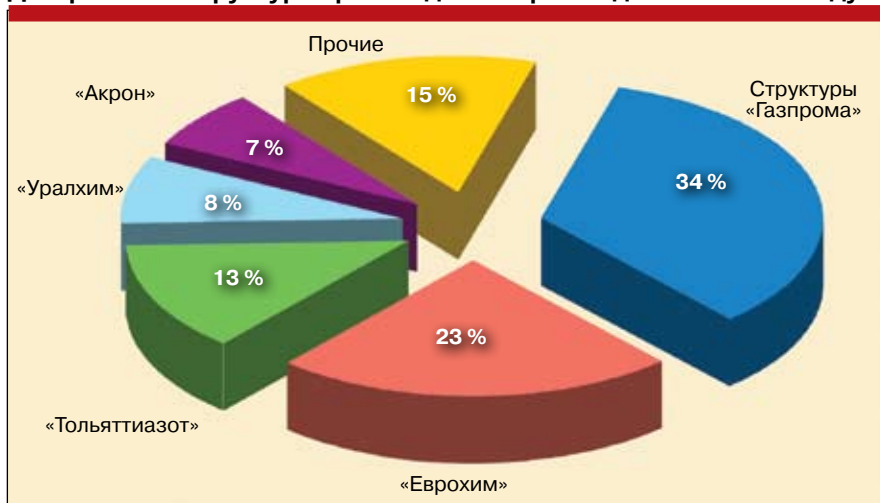
Диаграмма 1. Структура производства карбамида в РФ в 2008 году

Импорт карбамида в Россию незначителен, не превышает 1 % потребления. В целом потребление карбамида в России в 2008 году оценивается примерно в 400 тыс. т. При этом объем внесения удобрений вообще в России, по подсчетам специалистов, значительно ниже оптимального уровня, что говорит о существовании потенциала роста данного рынка.