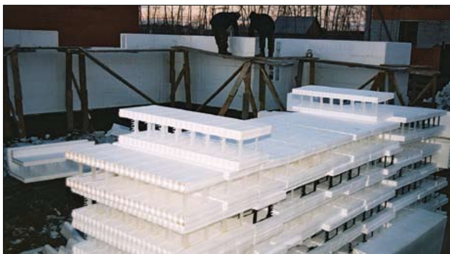
Основные недостатки пенополимеров — высокая горючесть и распространение грызунов.

Также эффективным утеплителем является песок перлитовый вспученный — инертный, негорючий, легкий, сыпучий материал, получаемый высокотемпературным обжигом перлита. Применяется как утеплитель жилых и хозяйственных построек в виде засыпок и штукатурок, а также в виде теплоизоляционных плит и термовкладышей в каменные и бетонные конструкции. Его же используют при сифонной разливке стали в виде штукатурок, растворов, перлитомоментных, пластоперлитовых и перлитостекольных изделий, а также активно применяют как фильтрующий элемент в пищевой промышленности. Производство перлита и вермикулита мало освоено отечественными компаниями, основные производители данных материалов находятся в Центральном и Сибирском регионах: ОАО «Стройперлит», ОАО «Теплоизолит», ЗАО «АЗТИ», ЗАО «Дмитровская теплоизоляция», ООО «Восточно-Сибирский завод железобетонных конструкций» и др. Следует отметить, что спрос на данные изоляционные материалы превышает предложение, поэтому представленные предприятия вводят новые мощности и постепенно увеличивают производство.