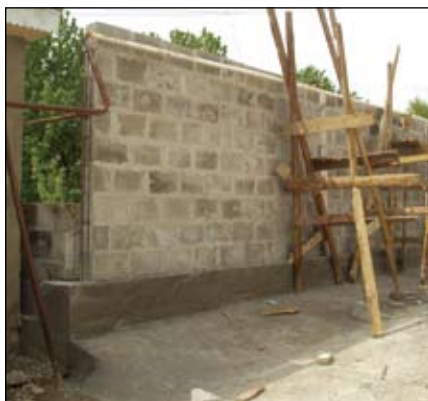
При попадании влаги и последующем промерзании пенобетоны разрушаются.