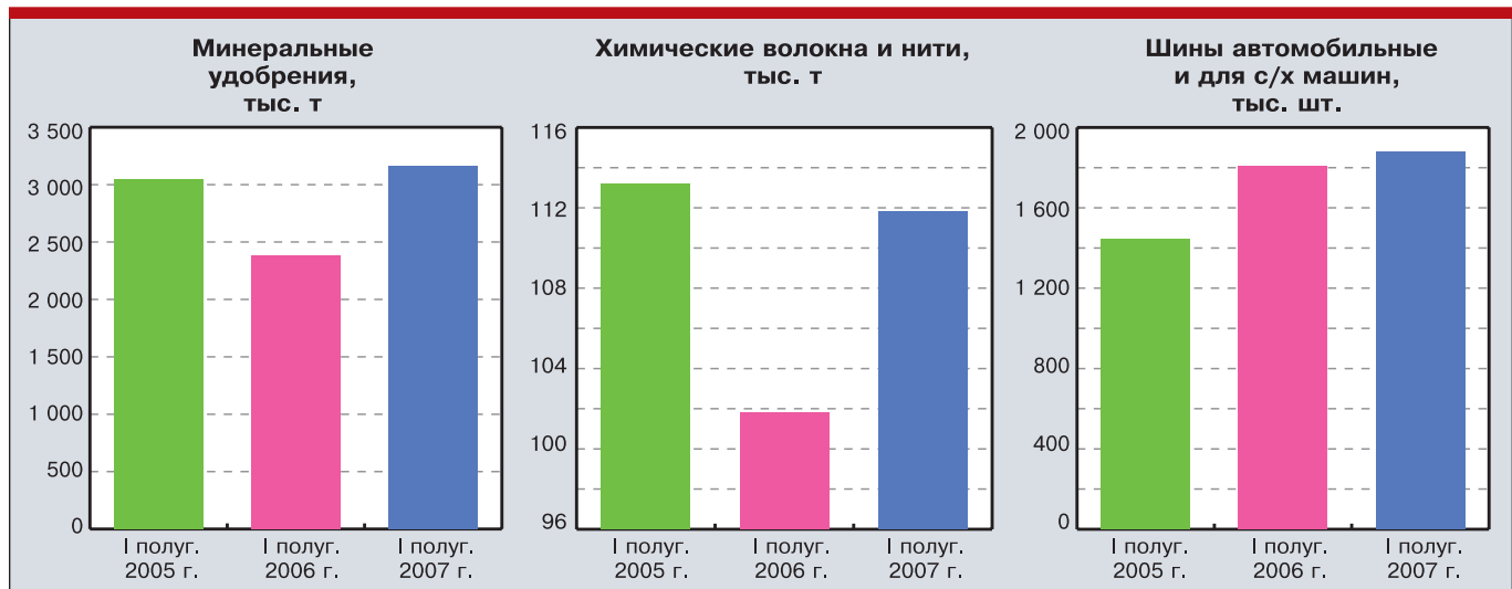
Диаграмма 2. Производство химической и нефтехимической продукции в январе–июне 2005–2007 гг.

пример, из Венесуэлы или Ирана, заканчивая использованием альтернативных видов топлива.