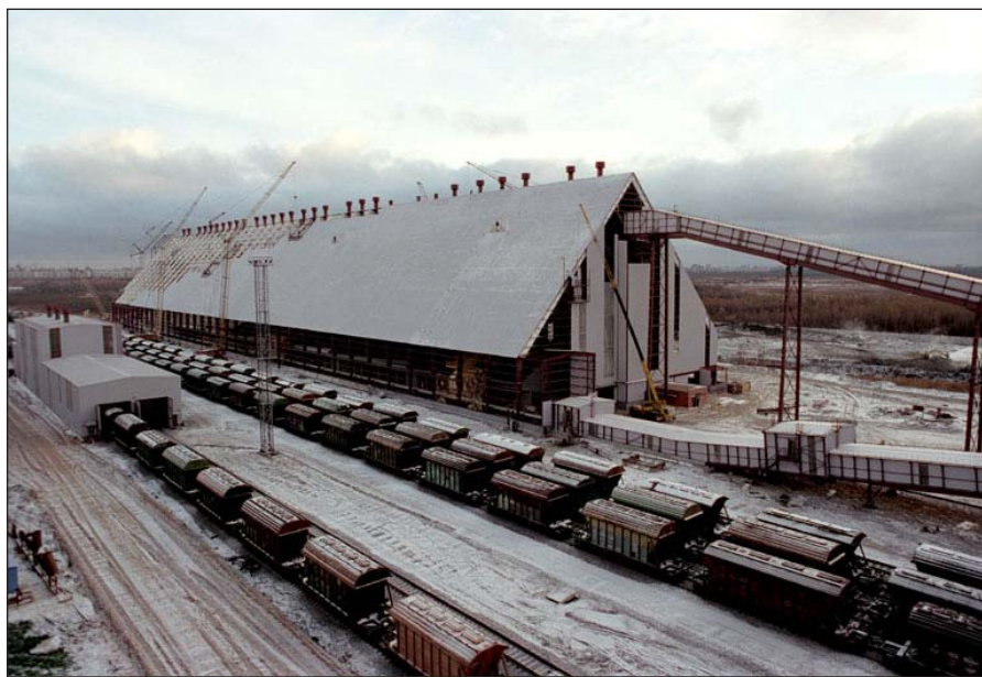
До морских портов удобрения транспортируются по железной дороге

Свою деятельность БКК начала в непростой для калийного рынка период. В течение последних нескольких лет спрос на калий рос, увеличивались и цены. В меньшей степени повышение цен коснулось Китая — крупнейшего потребителя калийных удобрений. В начале 2006 года БКК предложила китайцам повысить цену до средних для азиатского рынка значений или на 30–40 долларов по сравнению с прошлогодней ценой. В ответ китайцы предложили снизить цену на 20 долларов. В итоге контракт не был заключен.