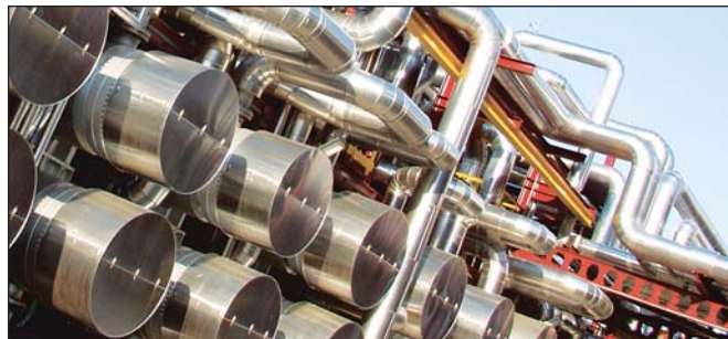
Vitol SA на ежегодные поставки 2 млн тонн нефти для

Кроме того нефтеконцерн Mazeikiu Nafta подписал договор с международной нефтетрейдерской компанией