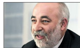
Виктор Феликсович Вексельберг, главный акционер «Реновы», «Суал-холдинга», совладелец «ТНК-ВР» и других компаний