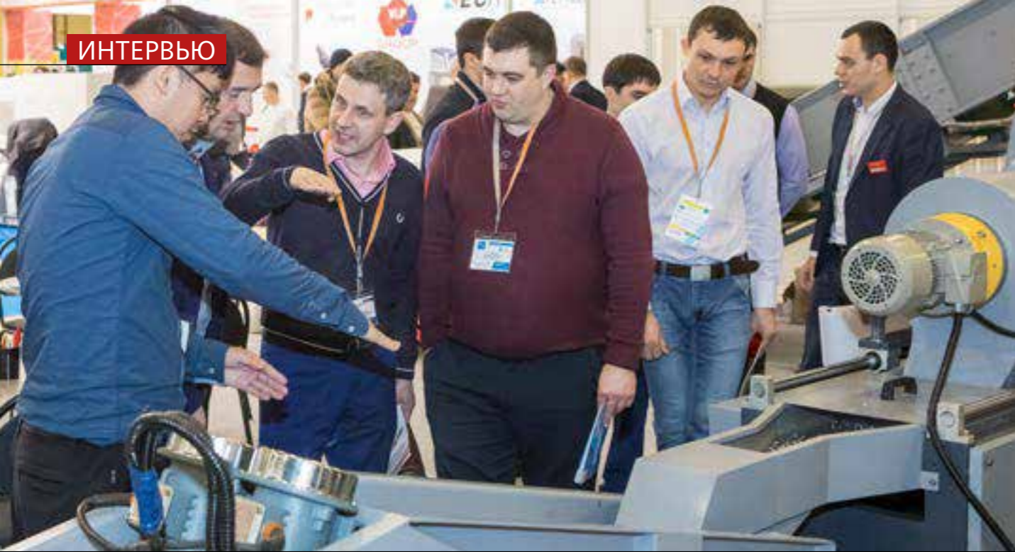
В специализированном проекте 3D fab + print Russia приняли участие 30 спикеров и более 400 слушателей.

сто ход рынка, отражение состояния научно-технического прогресса. Мы в Дюссельдорфе придумали бренд 3D-fab+print, который был представлен в прошлом году на выставке «К». Он пользовался таким головокружительным успехом, что в России мы не могли обойти его вниманием. Поставили секцию в павильон 2-3, с очень насыщенной конференц-программой, и около 15 фирм представили со своими работающими машинами или материалами. Вокруг раздела был ажиотаж не меньше, чем в Германии. Такую реакцию мы даже не могли ожидать. На конференции не хватало мест, люди стояли.