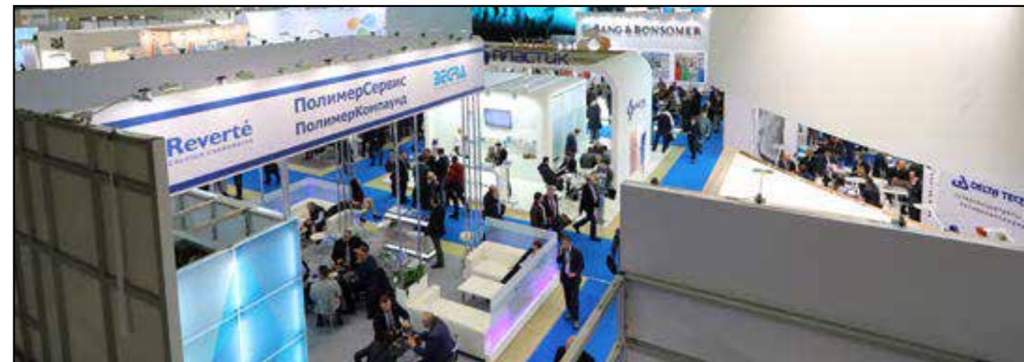
820 компаний из 33 стран мира продемонстрировали свою продукцию 23 тысячам посетителей на выставках «Интерпластика» и «Упаковка».

За годы деятельности на российском рынке совместно с российскими партнерами компания «Мессе Дюссельдорф» в сотрудничестве с Дюссельдорф организует в России ежегодно от 10 до 20 международных специализированных выставок примерно 60 тысячам российских и зарубежных посетителей по различной тематике.