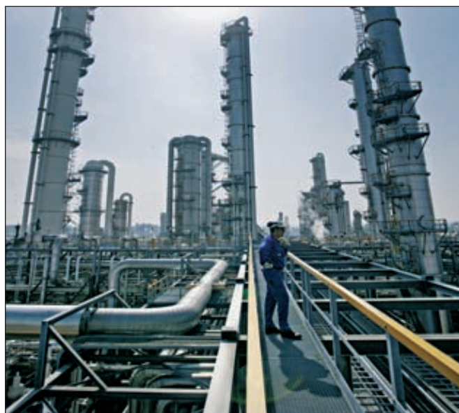
Завод Dow в Тернезене (Нидерланды) — крупнейший за пределами США

Компанией подписан протокол о намерениях относительно продажи биополимеров, разработаны клеи для ламинации на основе биологического сырья. В арсенале компании имеются технологии вторичного использования полимеров (модификаторы блок-сополимеризации, компатибилизаторы). ■