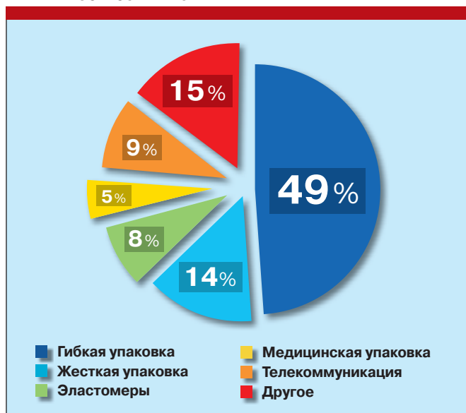
Рис. 1. Структура потребления ПЭ, 2010 г.