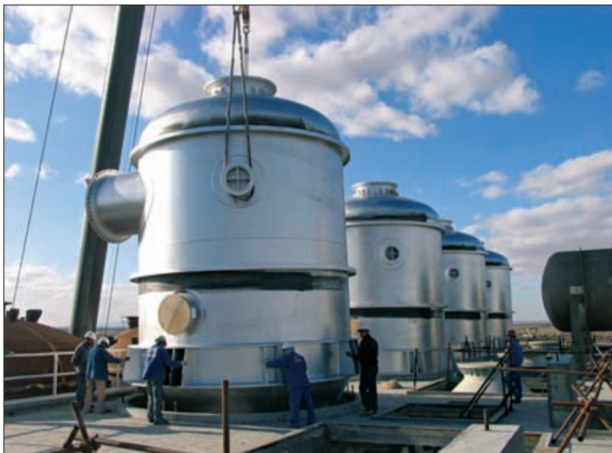
Строительство завода по производству фосфорной кислоты в районе Skhira (Тунис) мощностью 360 тыс. т/год

Россия остается одним из крупнейших мировых производителей фосфатных удобрений. По данным статистики, производство минеральных удобрений в России в 2010 году выросло на 22,6% по сравнению с показателем предыдущего года — до 17,936 млн т (в пересчете на 100% питательных веществ), при этом