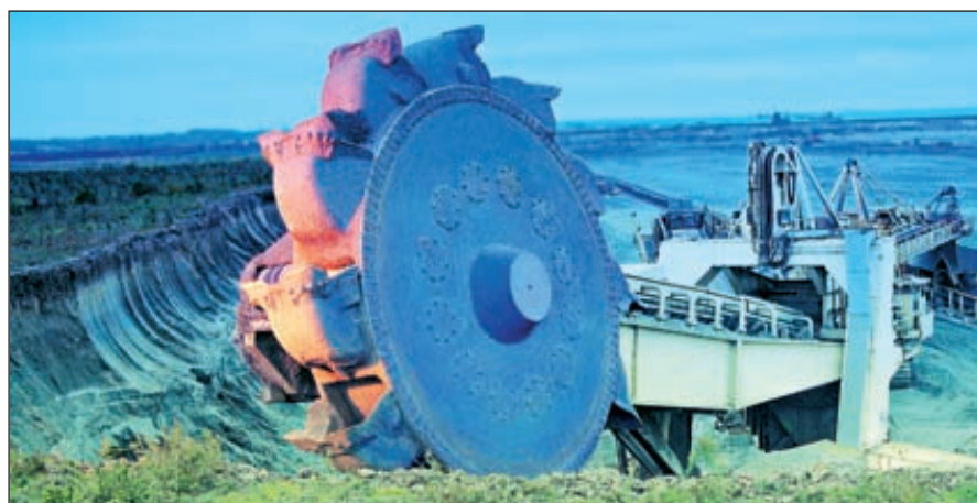
Российский рынок минеральных удобрений наряду с мировым демонстрирует устойчивую положительную динамику роста

Таким образом, российские игроки и производители фосфорной кислоты и удобрений из стран СНГ обладают неплохим потенциалом и пытаются удержать свои позиции, наращивая мощности и расширяя ассортимент продукции, тем более что пока ситуация на рынке этому благоприятствует. ■