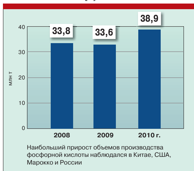
Рис. 2. Мировое производство фосфорной кислоты в 2008–2010 гг., млн т P_2O_5