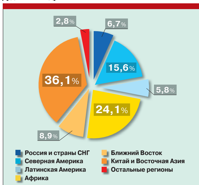
Рис. 3. Мировое производство фосфорсодержащих руд в 2010 году, %