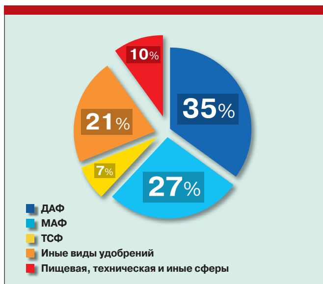
Рис. 1. Основные сферы применения фосфорной кислоты