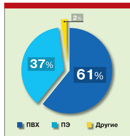
Рис. 2. Структура потребления в России кабельных композиций на основе ПЭ и ПВХ