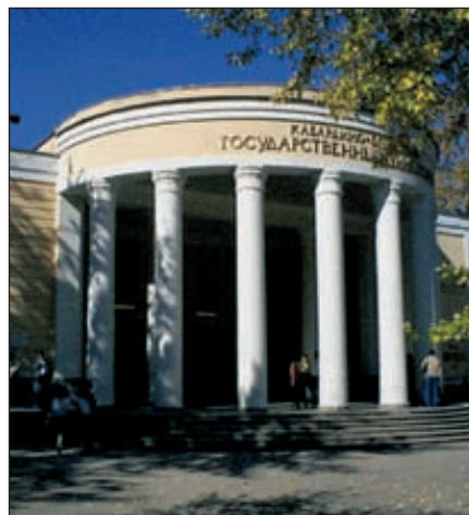
КБГУ им. Х. М. Бербекова

Экономический эффект будет достигнут за счет использования отечественного сырья и специальных свойств разрабатываемых материалов. Доля в суммарном эффекте за счет использования отечественных функциональных нанонаполнителей составит 20 %, за счет уменьшения добавок антипиренов (в 2–3 раза) в рецептуре — 15–20 % и за счет расширения диапазона температур эксплуатации — 30 %.