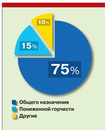
Рис. 2. Потребление кабельных ПВХ-пластиков в РФ