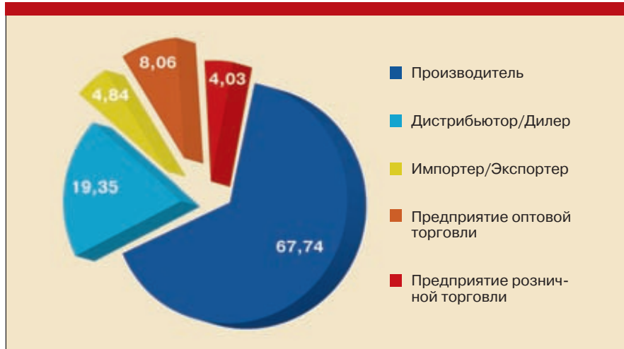
Рис. 1. Категории участников выставки «Нефть, газ. Нефтехимия-2010»

Международная конференция «Полимерные компоненты для различных отраслей промышленности», организованная ОАО «Татнефтехиминвест-Холдинг», прошла 9 сентября 2010 года в рамках выставки «Нефть. Газ. Нефтехимия» ➤