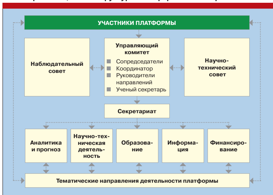
Рис. 3. Организационная структура. Платформа «Биоэнергетика»