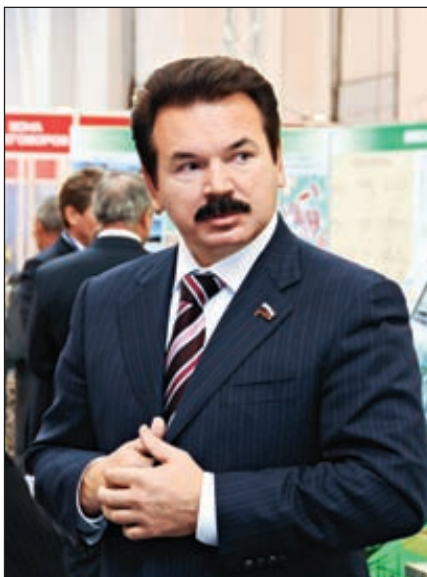
Михаил Сутягинский, депутат Государственной думы

Развитие биотопливной отрасли в России позволит через несколько лет покрыть не только внутренние потребности страны в этом виде топлива, но и замечать снижающийся экспорт нефти и газа.