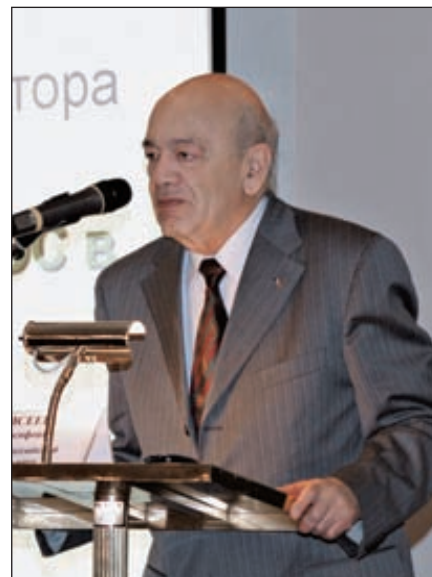
Илья Моисеев, академик РАН

Ученые всего мира разрабатывают биореакторы для синтеза микроводорослей, среди них есть и представители России. Так, Юрий Рамазанов создал вихревой биореактор (см. рис. 8). Потоки углекислоты, которые подаются через трубку, служат двум целям. Во-первых, углекислота — это сырье, из которого строится тело микроводорослей, с другой стороны, благодаря тому, что этот поток достаточно интенсивный, он смывает микроводоросли, не дает им застаиваться и загрязнять стенки фотобиореактора. Такую мобильную установку можно установить на палубе корабля, и дымовые газы реактора будут снабжать корабль топливом.