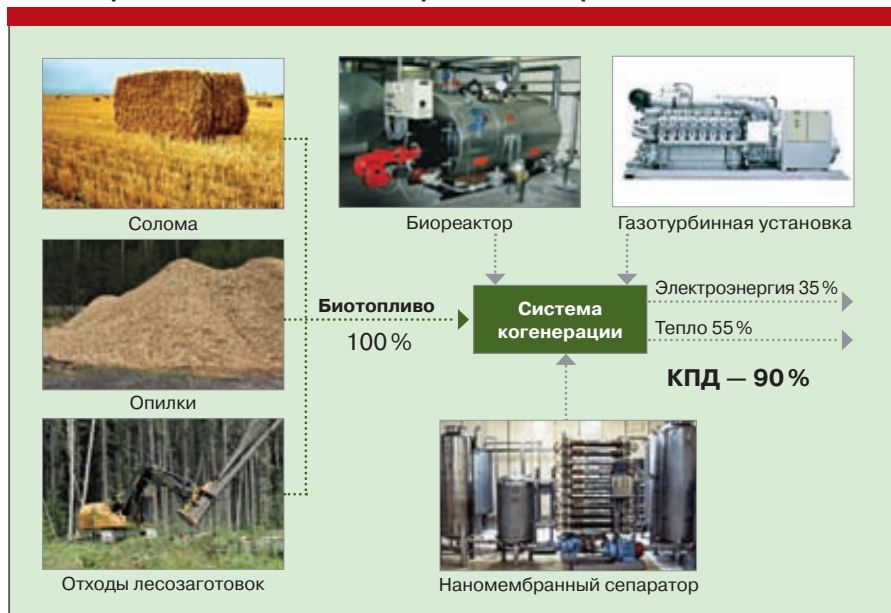
Рис. 5. Производство биогаза в Европе — 30 млрд м 3 в год

создание направлено на модернизацию уже существующих производств. При этом будут развиваться биотехнологии и осуществляться частичная замена углеродородного сырья на возобновляемое. Основой кластера станет завод по производству этил-трет-бутилового эфира с использованием в процессе дистилляции мембран нового поколения, разработанных ассоциацией «Аспект» под руководством профессора Трусова. Это позволит сэкономить до 30% энергоресурсов, требуемых для производства данного продукта, появится возможность производить бензин стандарта Евро-4, Евро-5 и Е-85. ЭТБЭ является уникальным по своим техническим свойствам продуктом, позволяющим без дополнительных затрат для нефтяных компаний,