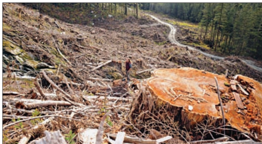
Биотопливо из древесных отходов после лесозаготовок является хорошей альтернативой для тех регионов, где существуют запасы древесины и стоимость древесных отходов не очень велика вследствие их большого количества