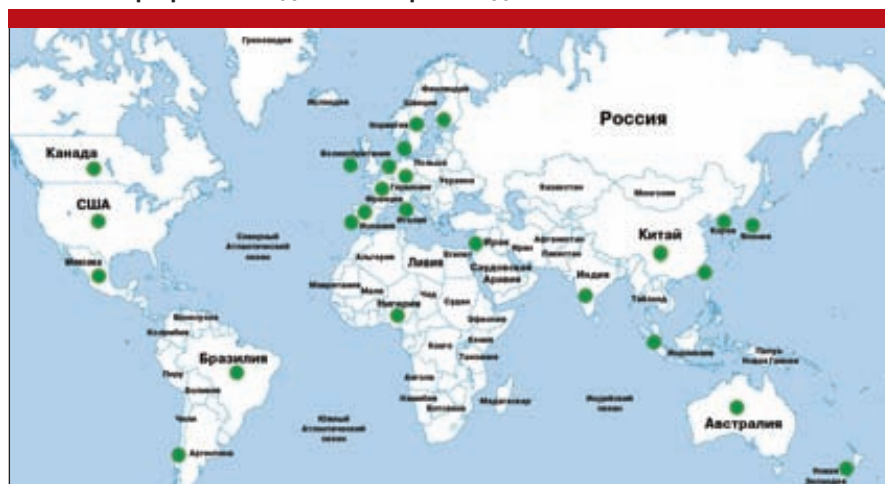
Рис. 4. География исследований, производства и использования биотоплив