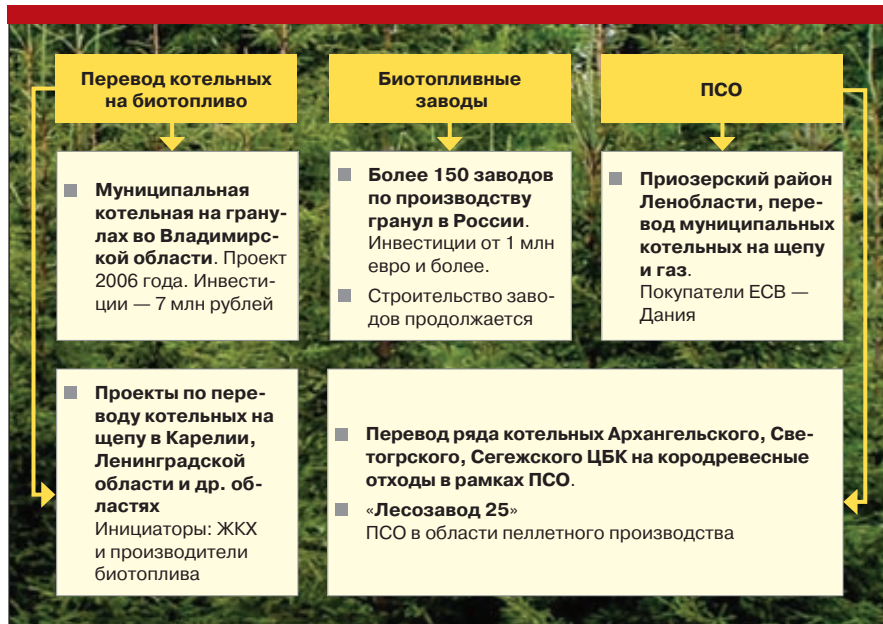
Рис. 6. Инвестиционные биотопливные проекты