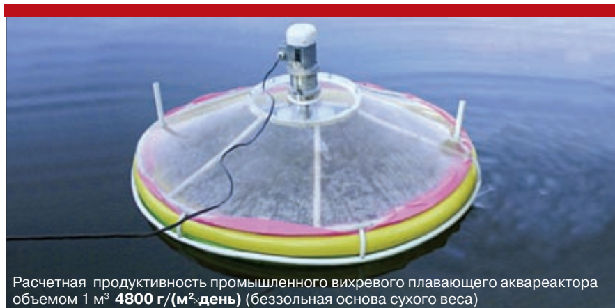
Рис. 8. Вихревой биореактор (Саяны)

В странах ЕС твердое биотопливо используется достаточно широко по экономическим причинам — оно дешевле импортных ископаемых видов топлива, и экологическим — Киотский протокол. Государство во многих европейских странах покрывает от 35 до 70 % стоимости перевода домашних котлов с ископаемых видов топлива на биотопливо, вла-