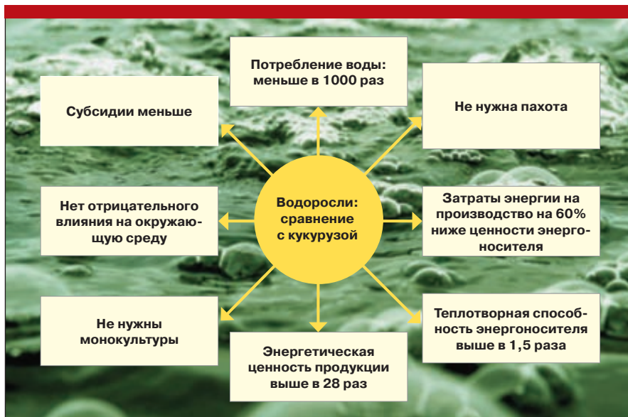
Рис. 7. Достоинства водорослей по сравнению с кукурузой

В рамках реализации проекта «Парк» рабочие места получают до 15 тыс. специалистов.