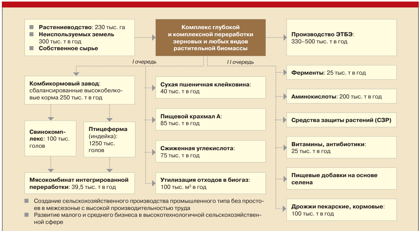
Рис. 1. Планы по созданию агропромышленного биокластера в Омской области