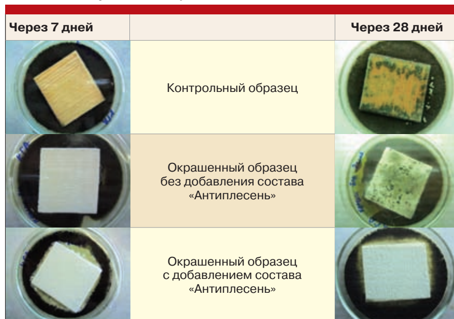
Таблица 1. Результаты микробиологических исследований

Состав является также прекрасной добавкой к герметикам и другим гомогенным смесям. Он предназначен для уничтожения грибка плесени на любой поверхности и для антибактериальной защиты внутренних помещений и фасадов зданий.