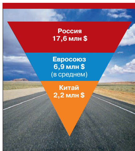
Рис. 1. Средняя цена за 1 км дороги с твердым покрытием на 2010 год для различных стран мира

чительная лизинговая составляющая, все оказалось гораздо сложнее. Здесь пришлось напрягаться: вести переговоры с банками, лизинговыми компаниями, с поручителями и клиентами, пользу-